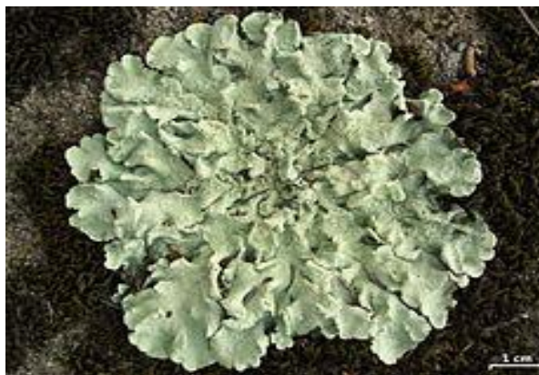
Slika 3. Vrsta Flavoparmelia caperata