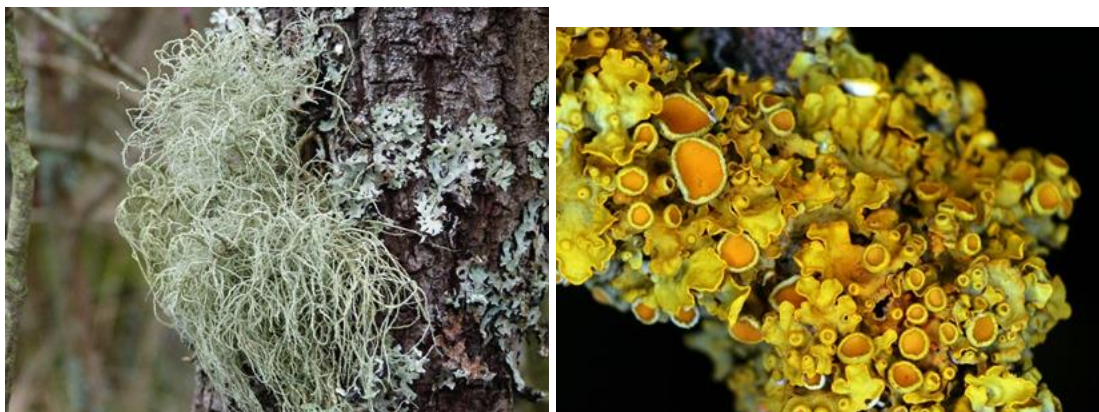
Slika 2. Primjer SO 2 osjetljive i tolerantne vrste:

SO 2 osjetljiva Usnea spp. (lijevo) i SO 2 tolerantna Xanthoria parietina (desno)