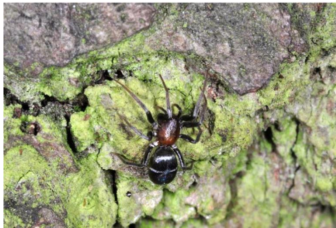
Slika 1. Micaria sociabilis

Micaria sociabilis pauk je iz porodice Gnaphosidae . Najčešće obitava na drveću središnje Europe. (slika 1.) Tijekom godine javljaju se dvije generacije potomaka – jedna u proljeće, a druga u rano ljeto.