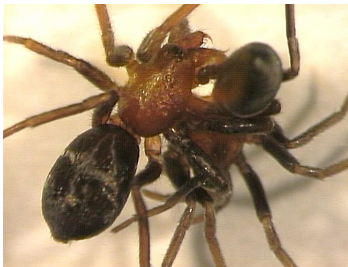
Slika 2. Mužjak M. sociabilis proždire ženku

( http://voices.nationalgeographic.com/2013/05/13/surprise-male-spiders-eat-females-too/ )