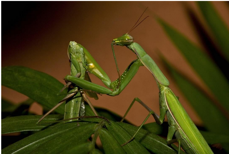
Slika 5. Seksualni kanibalizam kod M. religiosa

Mužjaci najčešće jako oprezno prilaze ženka i prestanu se micati kada ženka pogleda u njihovom smjeru. Najbrže se kreću prema ženki kada se i sama kreće u istom smjeru kao i oni ili kada vjetar uzrokuje gibanje okolne vegetacije. Mužjak se često ljulja pri prilasku imitirajući kretanje okolne vegetacije pod vjetrom. U većini slučajeva mužjak naskače na ženku s udaljenosti od 1-10 cm, najčešće kada ona gleda u suprotnom smjeru. Mužjaci ponekad klepeću krilima dok naskakuju na ženku. Seksualni kanibalizam događa se prije kopulacije, dok mužjak pokušava naskočiti na ženku. (Jayaweera i sur., 2015.) (Slika 5.)