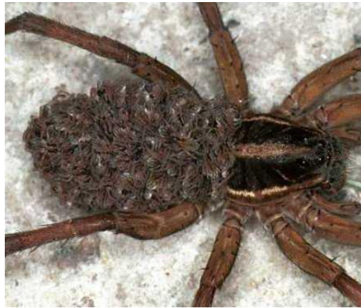
Slika 7. Ženka Lycosa furcillata s mladima ( http://ednieuw.home.xs4all.nl/australian/Lycosidae/Lycosidae.html )

Porodica pauka Lycosidae može se naći na skoro svim vrstama staništa i broji preko 2300 vrsta rasprostranjenih diljem cijelog svijeta. (slika 7.)