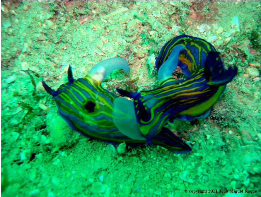
Slika 8. Dvije jedinke R. europeaea u borbi