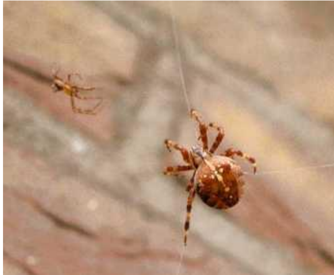
Slika 6. Mužjak A. diadematus prilazi ženki

Napadi ženki često ne dovode do smrti i kanibaliziranja mužjaka. Seksualni kanibalizam treba promatrati kao dvostruki događaj koji uključuje napad ženke, ali i uspješan čin ubijanja. Izgladnjele ženke djevice A. diadematus napadaju mužjake, ali rijetko završe sa obrokom. Neuspješni napadi prije kopulacije podrazumijevaju potrošnju energije za ženu. Ako ženka kanibalizira mužjaka za hranjive tvari, energetski trošak možda neće biti neutraliziran. Ženka bi trebala pokušati pojesti mužjaka samo kada će dobivene hranjive tvari nakon uspješnog napada donijeti energetski višak. Sličan odnos pronađen je kada se broj parenja uzima u obzir; iako su ženke koje su se prethodno već parile više sklone napadu prije kopulacije, nije bilo vjerojatno da će ubiti partnera. Glad motivira ženu na agresivno ponašanje, a vjerojatnost pojave kanibalizma prije ili poslije kopulacije određuje razlika u veličini partnera. Takvo ponašanje moglo bi se objasniti adaptive foraging hipotezom.