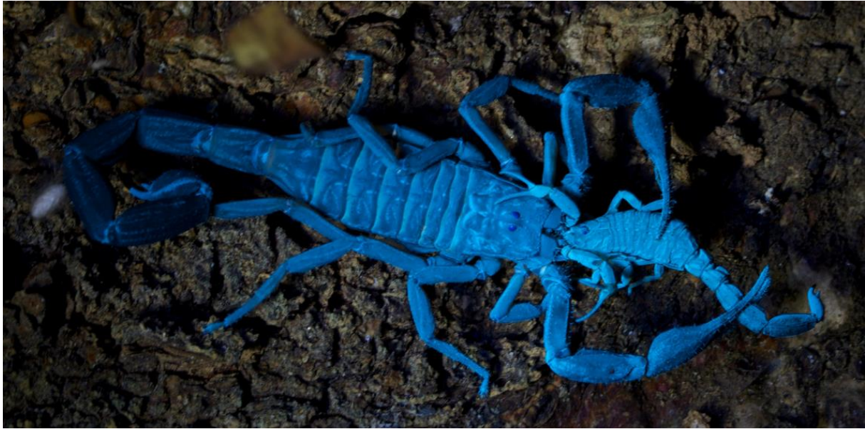
Slika 9. Pojava kanibalizma u škorpiona