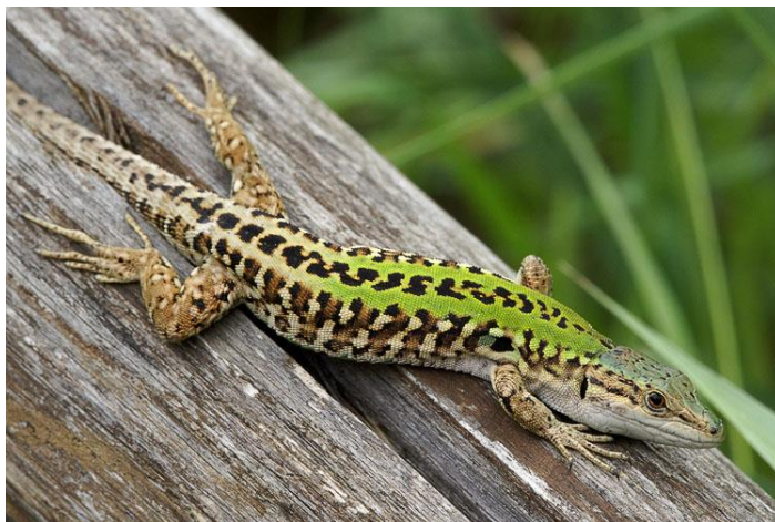
Slika 1. Primorska gušterica ( Podarcis sicula )

Primorska gušterica je robusna vrsta guštera (55-70mm duljine), poikilotermna i vrlo aktivna životinja u potrazi za hranom. U prirodi većina muških jedinki dosegne spolnu zrelost u dobi od jedne godine, a ženka kojima do spolne zrelosti ponekad treba i do dvije godine, liježe 2-7 jaja i do 5 puta godišnje. Mužjake tipično krasi veća glava i dulji stražnji udovi u usporedbi s ženkama, a također aktivnije izlučuju feromone zbog veličine femoralnih pora. (Vervust i sur., 2007). Prehrana ovih guštera je iznimno raznolika te uključuje širok spektar insekata i beskralješnjaka (skakavci, kornjaši, gusjenice, i sl.), a pronađeni su rijetki slučajevi prehrane lišćem ili cvijetovima (Zuffi i Giannelli, 2013)