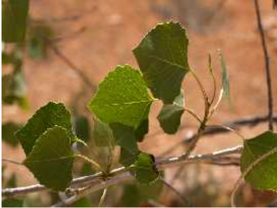
Slika 3. Liš e fremontske topole ( Populus fremontii S. Watson)

pridonijelo je 25 % ve o j stopi emergencije nego liš e kojem je za razradnju potrebno manje vremena. Duže trajanje razgradnje osigurava izvore hrane tijekom dužeg razdoblja. Liš e koje se brzo razgra uje ima prednost u ve o j raznolikosti kukaca zbog velike koli ine nutrijenata koja je na raspolaganju kukcima usitnjiva ima (Compson i sur. 2013).