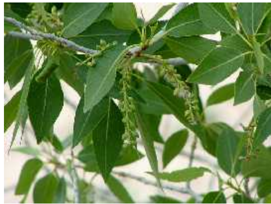
Slika 4. Liš e uskolisne topole ( P. angustifolia James) (preuzeto s http://calphotos.berkeley.edu )