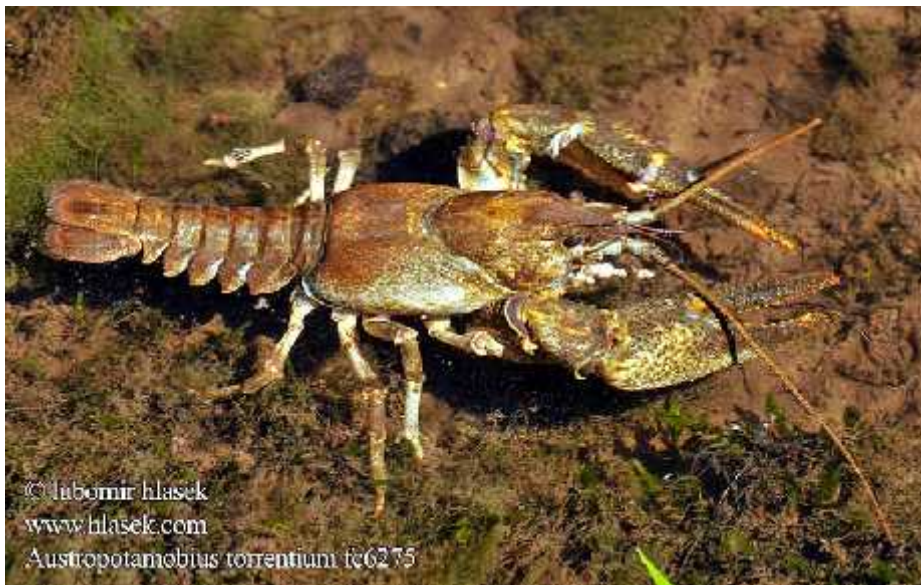
Slika 8. Vrsta Austropotamobius torrentium

Poto ni rak kopa jazbine u obalama vodotokova, a skrovište nalazi pod potopljenim korijenjem ili kamenjem, gdje se no u hrani razli itim vrstama biljaka i otpalim liš em dok se juvenilni rakovi hrane manjim vodenim beskralješnjacima. Poto ni rak nastanjuje brze tokove hladnih potoka s kamenim dnom na višim nadmorskim visinama, iako neki žive i u ve im jezerima i rijekama kao autohtone vrste. U Hrvatskoj se javlja u rijekama savskog slijeva, a prisutan je i u rijeci Zrmanji i Krki te njihovim pritocima. Kao i kod rije nog raka, poto ni rakovi ugroženi su zbog antropogenog utjecaja na vodotokove i unosa alohtonih vrsta. Posebno su osjetljivi na pojavu ve ih koli ina otpadnih tvari u vodi koje negativno utje u na njihov razvoj i razmnožavanje ( www.dzpz.hr ).