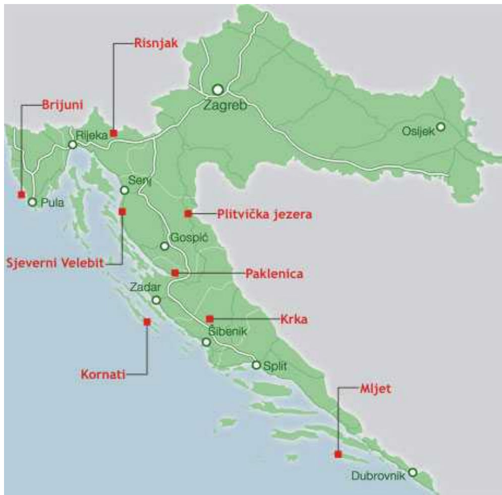
Slika 1. Geografski položaj nacionalnih parkova u Republici Hrvatskoj ( www.camping.hr/hr/hrvatska/nacionalni-parkovi )

NP Sjeverni Velebit najve im je dijelom prekriven šumama, a osim šuma ovdje nalazimo i travnjake, stijene, kamenite vrhove, dok cjelokupno podru je sadrži mnoštvo krških oblika na površini i u podzemlju. Upravo takva raznolikost staništa utje e na raznolikost biljnog i životinjskog svijeta. Unutar Parka nalazi se i strogi rezervat Hajdu ki i Rožanski kukovi, te mnoštvo speleoloških objekata i planinarskih staza (Brali , 2005).