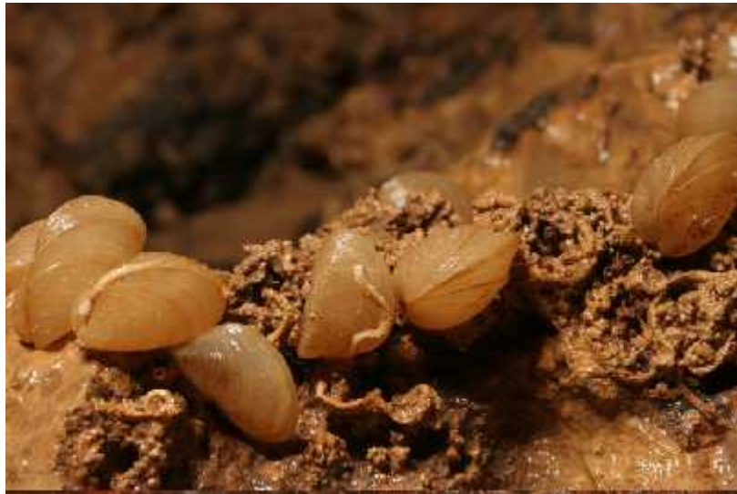
Slika 6. Vrsta Congeria kusceri u Markovom ponoru

Dinarski špiljski školjkaši najviše su ugroženi intenzivnom urbanizacijom u neposrednoj blizini staništa koje uzrokuje zatrpavanje speleoloških objekata te one iš enje podzemnih voda krutim otpadom i otpadnim vodama iz industrija i doma instava. Izravno su ugroženi smanjenjem kvalitete podzemne vode te promjenom režima vode ime za vrstu postoji velik rizik od nestajanja na prirodnm staništu. U neposrednoj blizini Markovog ponora izgra ena je hidroelektrana Senj. Gradnja bilo kakvih hidrotehni kih zahvata dovodi do promjena u kvaliteti i razini podzemnih voda te smanjenja populacije ili njenog nepovratnog ošte enja (Bedek i sur., 2009).