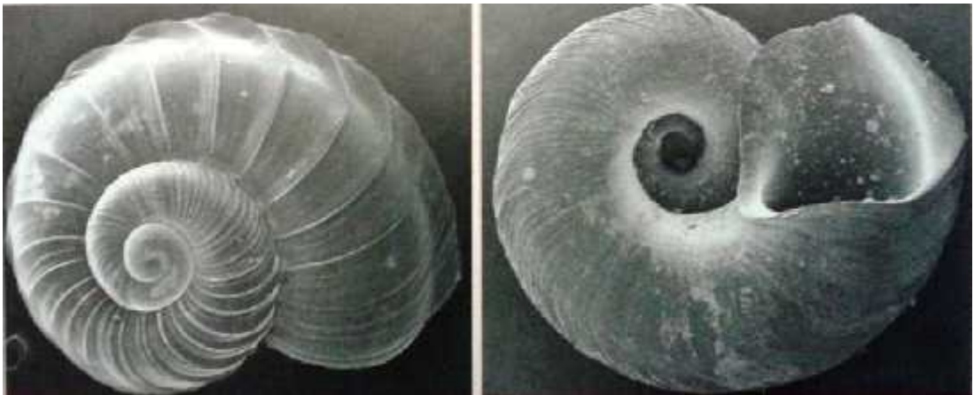
Slika 4. Vrsta Dalmatella sketi

Ova vrsta kriti no je ugrožena (CR) zbog promjena režima voda, posebnog zbog prekomjerenog crpljenja vode. Svaka promjena u kvaliteti vode tako er ugrožava populaciju ove vrste, putem neodgovornog odlaganja komunalnog otpada i one iš enja podzemne vode putem oborinskih voda zbog divljih odlagališta otpada (Ozimec i sur., 2009).