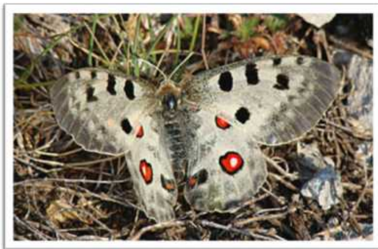
Slika 12. Vrsta Parnassius apolo velebiticus

Ova vrsta ugrožena je zbog sukcesije travnjaka zbog depopulacije planinskih podru ja što je jedan od glavnih problema u NP Paklenica. Ako ne postoji ljudska aktivnost i planinsko ov arstvo, izgradnja te gospodarenje planinskim livadama dolazi do zaraštavanja, prirodnog pošumljavanja i nestajanja biljaka hraniteljica o kojima ovisi životni ciklus vrste, a postoji i stalna prijetnja od strane kolekcionara zbog izuzetne ljepote ove vrste (Šaši i sur., 2013).