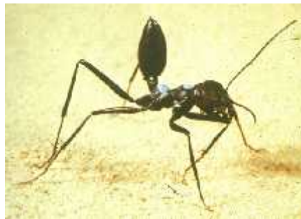
Slika 3. Izgled pustinjskog mrava Cataglyphis fortis

sušnim područjima na raspolaganju imaju malo živog plijena te su zbog toga prešli na nekrofagiju odnosno hranjenje mrtvim kukcima (kornjašima, drugim mravima). Dodatak prehrani im je isisavanje sokova iz biljaka. Preko zime se nalaze u svojim nastambama dok ljeti, preko dana, idu u potragu za hranom. Mravi zaduženi za sakupljanje rezervi hrane su uvijek najstariji mravi. Imaju duge noge, zbog čega se mogu brzo kretati. Putuju bez pratnje i donose u nastambu bilo kakav plijen. Tijekom traženja izloženi su napadima predatora, ali i velikim vrućinama pa može doći i do dehidracije. Također imaju poseban način držanja zatka kako ne bi bio u kontaktu s vrućom površinom (sl. 3) (Keller, 2009).