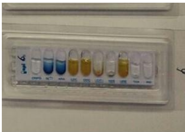
Slika 1. Izgled pozitivnog Api testa za P. aeruginosa .

Za potvrdu sojeva smo koristili test na citokrom oksidazu te komercijalni biokemijski niz API 20E/NF (Slika 1). Citokrom oksidaza testom smo dokazivali proizvodnju enzima citokrom C oksidaze. Taj enzim, ukoliko je prisutan u ispitivanoj bakterijskom kulturi, u prisutnosti atmosferskog kisika katalizira oksidaciju fenilendiamina iz testa do tamnoljubičaste komponente indofenola (Stilinović i Hrenović, 2009). Test se izvodio na način da se malo bakterijske kulture mikrobiološkom ušicom nanijelo na disk natopljen sa dimetil p-fenilen diaminom. Pojava ljubičaste boje se smatrala pozitivnom reakcijom. API komercijalni test sadrži niz supstrata za određivanje biokemijskih reakcija te daje odgovor o kojoj je bakteriji riječ. API test se izvodio prema uputama proizvođača. Uzorkom bakterijske kulture su napunjene jažice sa supstratima te je test inkubiran 24 h na 37 °C, u vlažnom okolišu. Vlažan okoliš je postignut tako što su okolne jažice bile prelivene fiziološkom otopinom. Prema boji reakcija smo očitali rezultate te prema njima, u predviđenom komercijalnom programu (Apiweb, BioMerieux) pronašli o kojoj se bakteriji radi. Za pokus smo odabrali 10 različitih sojeva P. aeruginosa koji su potvrđeni API testom i testom na citokrom oksidazu, a izdvojeni su iz različitih uzoraka vode.