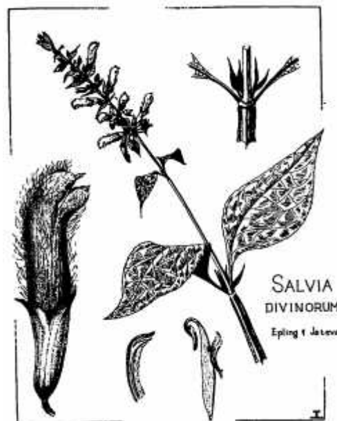
Slika 1. Božanska kadulja

Božanska kadulja se vrlo lako može vegetativno razmnožavati reznicama pa se u zadnjih nekoliko desetljeća često može naći u mnogim botaničkim vrtovima i privatnim kolekcijama diljem svijeta. Smatra se da su gotovo sve božanske kadulje, koje su u „optjecaju“, potomci 2 vegetativno razmnožena roditelja, odnosno da su potomci 2 linije – Bunnellove linije i Blosserove linije 2 (Siebert 2003).