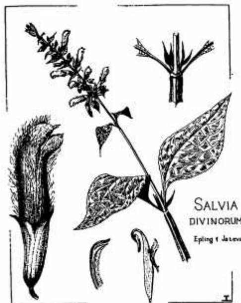
Slika 1. Božanska kadulja

Božanska kadulja se vrlo lako može vegetativno razmnožavati reznicama pa se u zadnjih nekoliko desetljeća često može naći u mnogim botaničkim vrtovima i privatnim kolekcijama diljem svijeta. Smatra se da su gotovo sve božanske kadulje, koje su u „optjecaju“, potomci 2 vegetativno razmnožena roditelja, odnosno da su potomci 2 linije – Bunnellove linije i Blosserove linije 2 (Siebert 2003).