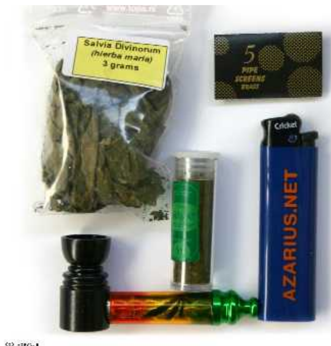
Slika 4. Pribor za pušenje božanske kadulje ( http://azarius.pt/smartshop/salvia_divinorum/salvia_padi_small )

se ne bi trebala pomiješati s njenom toksi nosti jer je salvinorin A po istraživanjima tvar niske razine toksi nosti.