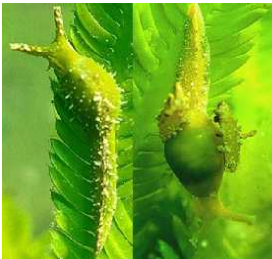
Slika 6. Herbivorni puževi Oxynoe olivacea i Lobiger serradifalci

Osnovni razlog zbog kojeg se Caulerpa taxifolia i Caulerpa racemosa tako brzo šire jest taj što ne postoje herbivorni organizmi koji bi se njima hranili i tako kontrolirali njihovo širenje. Zbog toga svaki dan te alge zauzimaju sve veća morska prostranstva. Hridinski ježinac i riba salpa glavni su sredozemni makroherbivori, no oni se ne hrane kaulerpama. Sve alge roda Caulerpa proizvode toksične metabolite koji im služe kao zaštita od herbivora, osim od nekih. Jedna skupina puževa prilagodila se hranjenju kaulerpama jer su evolucijski razvili otpornost na njezine metabolite. Iako ih prerađuju u još toksičnije spojeve i pohranjuju u svome tijelu pa su tako potpuno zaštićeni od predatora. Kaulerpama se hrane tako da isisavaju njihovu gigantsku citoplazmu. Ne postoje tako velike alge s tolikom količinom citoplazme koje bi puževi mogli isisavati pa su zato kaulerpe njihova jedina hrana. U Sredozemnom moru žive dvije vrste takvih puževa, a do pojave invazivnih kaulerpi oni su se hranili jedinom autohtonom vrstom, C. prolifera . To su endemični sredozemni puževi gola i Oxynoe olivacea i Lobiger serradifalci (Sl. 6.).