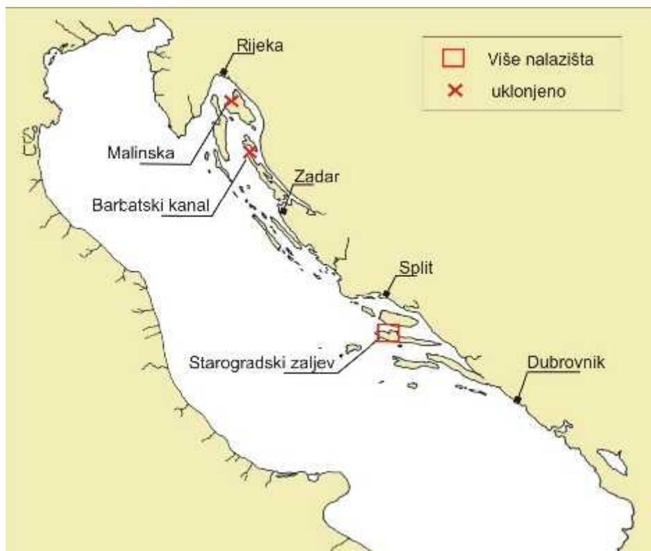
Slika 2. Rasprostranjenost alge C. taxifolia u Jadranu 2008. g.

Do danas Caulerpa taxifolia u Jadranskom moru pronađena je jedino u hrvatskom podmorju i to na tri lokacije: Starogradski zaljev kod otoka Hvara, kod Malinske na otoku Krku i u Barbatskom kanalu između otoka Raba i otoka Dolina (Sl. 2.).