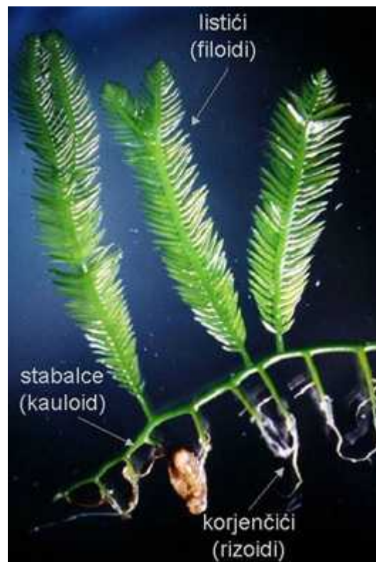
Slika 1. Hatitus alge Caulerpa taxifolia

Caulerpa taxifolia je lijepa fluorescentno zelena alga građena od puzajućeg stabalca koji može narasti preko 1 metar u dužinu, brojnih korjenika kojima je u vršenju za dno i rasperanih listića koji mogu narasti od 5 do 65 centimetara u dužinu. Pošto listići podsjećaju na listove tise (rod Taxus - tisa) tako je alga i dobila ime. U Sredozemnom moru oni dosežu dužinu od 10-30 centimetara, a ponekad čak i do 80 (Sl. 1.).