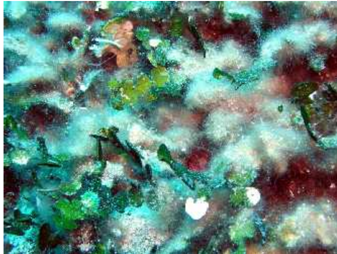
Slika 5. Vataste prevlake alge Womersleyella setacea

naslaga dolazi do pojačane sedimentacije što negativno utječe na autohtone organizme (Sl. 5.). Unatoč niskim temperaturama mora u zimskom razdoblju alga uspješno raste.