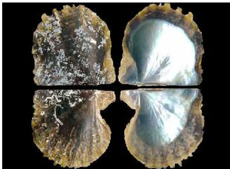
Slika 4. Vrsta Pinctada radiata

Vrsta Pinctada radiata (Leach, 1814) (sl.4.) iz porodice Pteriidae poznata kao biserna školjka invazivna je vrsta Jadranskog mora. Način unosa još uvijek nije poznat, ali se smatra da je moguć i unos putem Sueskog kanala, aktivnostima vezanim za akvakulturu te pomorskim prijevozom. Vrsta je najčešće pronađena na muljevitim supstratima na dubinama od 5 do 25 metara (Dogan i sur. 2008).