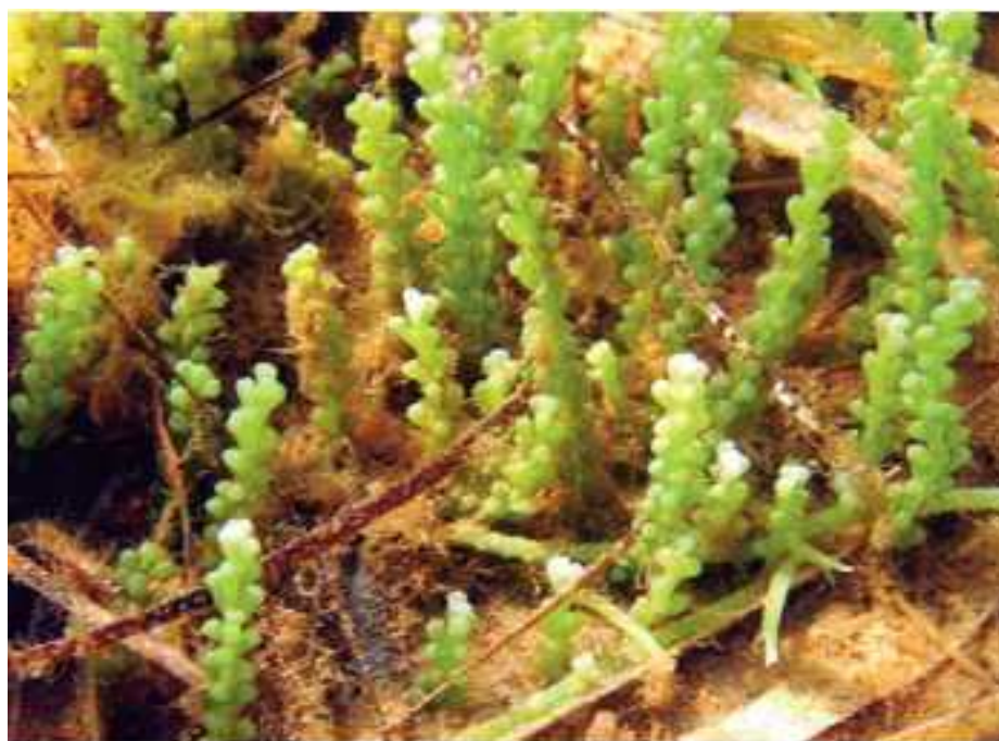
Slika 2. Vrsta Caulerpa racemosa var. cylindracea

Vrsta Caulerpa racemosa smještena je na popis invazivnih vrsta uvođenjem ovjeka ili nepoznatog vektora (Tablica 1). Tropska područja su prirodna staništa ove vrste. Prvi je puta detektirana na području Tunisa 1926. godine, vjerojatno se proširila kao migrant iz Crvenog mora. Nije smatrana tipičnom invazivnom vrstom sve do 1990. godine kada je pronađena na području Libije njezin novi oblik Caulerpa racemosa var. cylindracea za koji se odredilo da je genetički australskog podrijetla. Caulerpa racemosa var. cylindracea je jedna od vodećih invazivnih vrsta