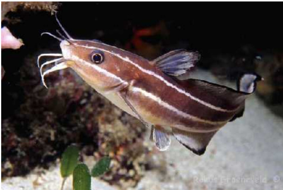
Slika 6. Vrsta Plotosus lineatus

Plotosus lineatus (Thunberg, 1787) (Sl.6.) je vrsta ribe koja je poznata po svojoj izrazitoj otrovnosti. Otrovnne žlijezde nalaze se na području leđne i prsne bodlje. Prijavljeno je nekoliko slučajeva trovanja tim toksinom na području Mediterana.