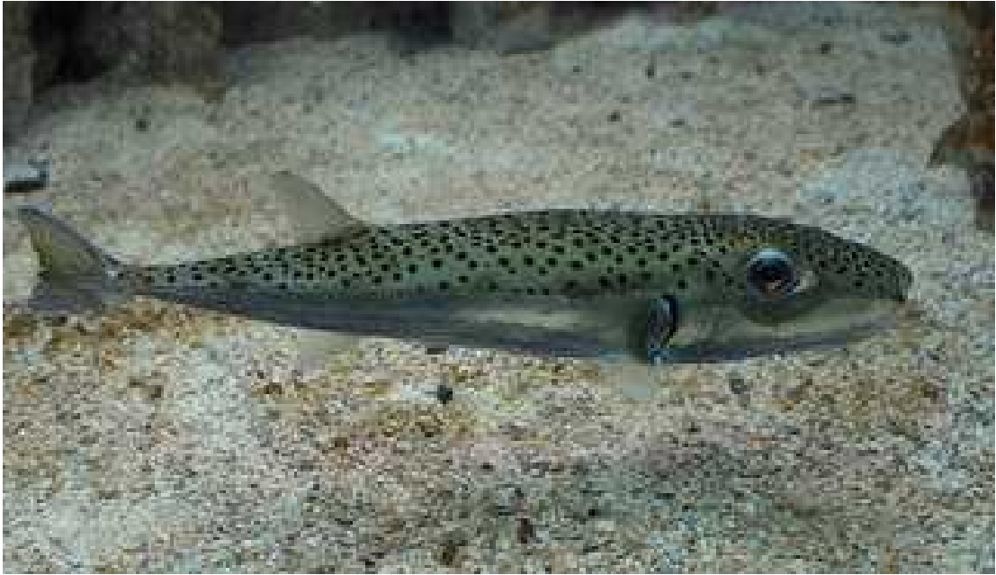
Slika 5. Vrsta Lagocephalus sceleratus

Plotosus lineatus (Thunberg, 1787) (Sl.6.) je vrsta ribe koja je poznata po svojoj izrazitoj otrovnosti. Otrovnne žlijezde nalaze se na području leđne i prsne bodlje. Prijavljeno je nekoliko slučajeva trovanja tim toksinom na području Mediterana.