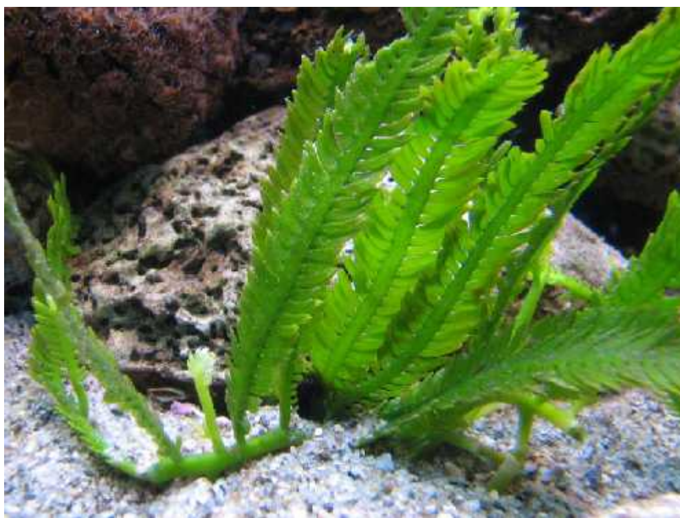
Slika 1. Vrsta Caulerpa taxifolia

Prema kategoriziranim podacima vrsta Caulerpa taxifolia smještena je na popis invazivnih vrsta unešenih djelovanjem ovjeka ili nepoznatog vektora (Tablica 1). Njezino prirodno stanište su tropska mora u kojima tvori manje zajednice. U tropskim morima nije uzrok ekoloških problema jer njezino širenje drže pod kontrolom kompetitivne vrste te herbivori koji se njome hrane. Njezina prva pojavnost u Sredozmnom moru bila je u akvarijima koji su predstavljali floru i faunu tropskih mora. Njezina uloga bila je ukrasna te se ljudskom nepažnjom počela širiti prema prirodnim staništima. Prva mala kolonija od metra kvadratnog slučajno unesena 1984. godine od strane Oceanografskog muzeja u Monaku do 1992. godine proširila se na više od 6000 hektara. Prekrila je više od 13 000 hektara morske obale 6 država, Monako, Francusku, Italiju, Hrvatsku, Španjolsku te