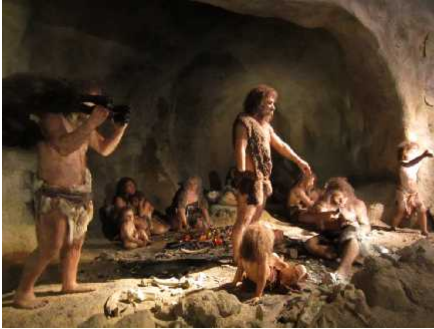
slika 8. Rekonstrukcija Homo sapiens neanderthalensis u muzeju u Krapini