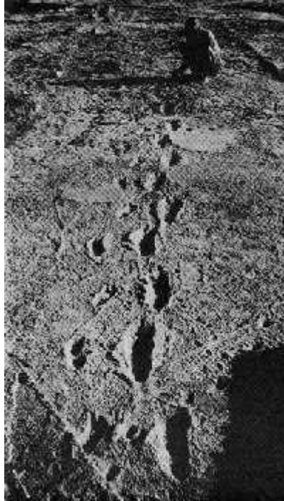
slika 4. Stope hominida fosilizirane u vulkanskom pepelu