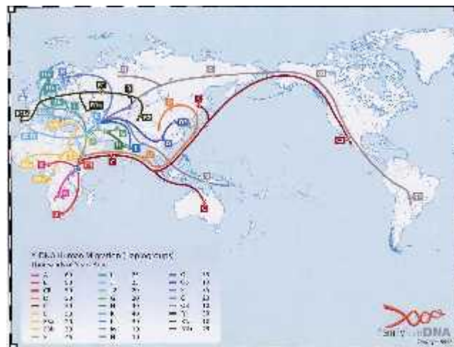
slika 2. Porijeklo ljudi prema markerima Y-kromosoma