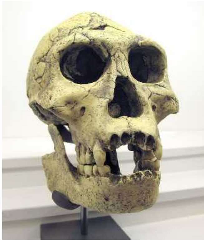
slika 6. Fossilna lubanja D2700 i eljust D2735, Homo erectus