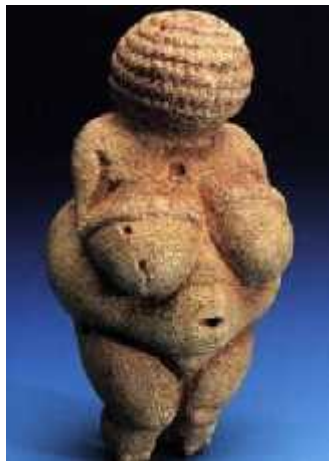
slika 9. Willendorfska Venera

prije otprilike 12 000 godina. Alati koje su koristili su bili sofisticiraniji u odnosu na njihove pretke, a izrađivali su ih od kamena, rogova, kostiju i drveta. Skloništa su im bile pećine, ali su i konstruirali skloništa na otvorenim područjima, pokapali mrtve te izvodili ritualne pogrebe. Prije 45 000 do 30 000 godina, kada su došli u doticaj sa neandertalcima, kod neandertalaca je uočen znatan iskorak u smjeru unaprijeđenja alata i oružja koje su do tada koristili. Stručnjaci smatraju kako su metode izrade tih alata naučile ili od modernih ljudi. Moderni ljudi su također se mogli služiti i sa ošticama, u pravilu od kamena, koje su im služile prilikom obrane i bile su mnogo efikasnije u lovu. Svaka regija je imala zasebnu karakterističnu kulturu. Uporabom oštica u lovu, poboljšao im se dnevni ulov. Svoje mrtve su pokapali sa oružjem koje su izrađivali, oružjem, ornamentima, a to nam govori da su vjerovali u postojanje zagrobnog života. Osim oružja i oruđa, izrađivani su i razni kipovi životinja i ljudi, koji su predstavljali neka njihova božanstva. Primjer toga je willendorfska Venera (sl.9), kip koji predstavlja ženu sa izraženim seksualnim obilježjima, a predstavljala je simbol plodnosti.