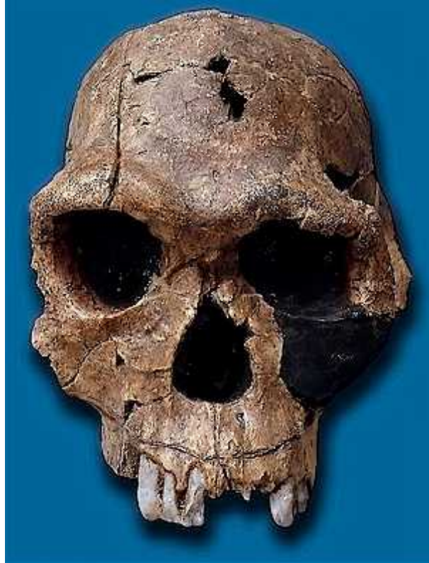
slika 5. KNM ER 1813

Osim fosila lubanja, pronađeni su fosili ostalih kostiju, prema kojima se može doći do zaključka da se pobojšala uspravnost tijela, što je dovelo do pomaknutog zatiljnog djela prema naprijed, a bedrena kost je imala veliku, robusnu zglobnu glavicu. Kako je H. habilis bio manje tjelesne građe i relativno primitivne morfologije, mnogi su paleontolozi zajedno sa Richardom Leakeyom predložili reklasifikaciju vrste u Australopithecus habilis , te da ga se isključi iz roda Homo .