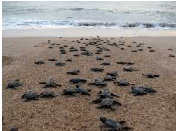
Slika 4 . Put mladih kornja a prema horizontu ( http://galleryhip.com/baby-sea-turtle-top-view.html )

upravo površina mora. Nakon što u u more, instinktivno se orijentiraju prema pu ini plivaju i prema valovima. Pitanje je sada kako se orijentiraju u otvorenom moru gdje nema nikakvih orijentira? ( http://www.plavi-svijet.org/hr/kornjace/ )