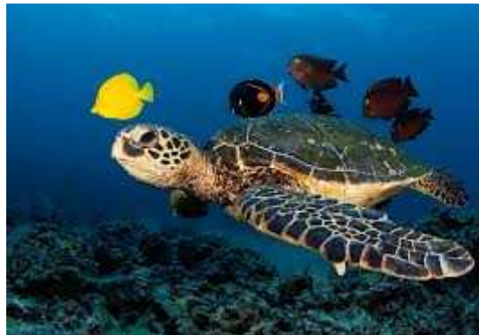
Slika 6. Glavata želva

( http://www.kornjace.com/modules/cjaycontent/index.php?id=25 ) .