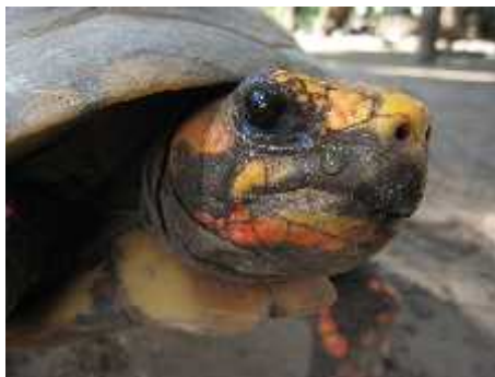
Slika 1. Na in izlučivanje viška soli

Morske kornjake su ektotermni organizmi što znači da ne mogu regulirati tjelesnu temperaturu poput endotermnih organizama, već ona varira ovisno o vanjskim uvjetima. Jedan od načina kako reguliraju svoju temperaturu je ponašanjem. Kada im nedostaje topline i žele se ugrijati, mogu izroniti na površinu i tamo se sunčati. Na taj način podižu svoju tjelesnu temperaturu. Nasuprot tome, zarone li na veću dubinu gdje je temperatura puno niža, tijelo im se hladi ( http://www.plavi-svijet.org/hr/kornjace/ ).