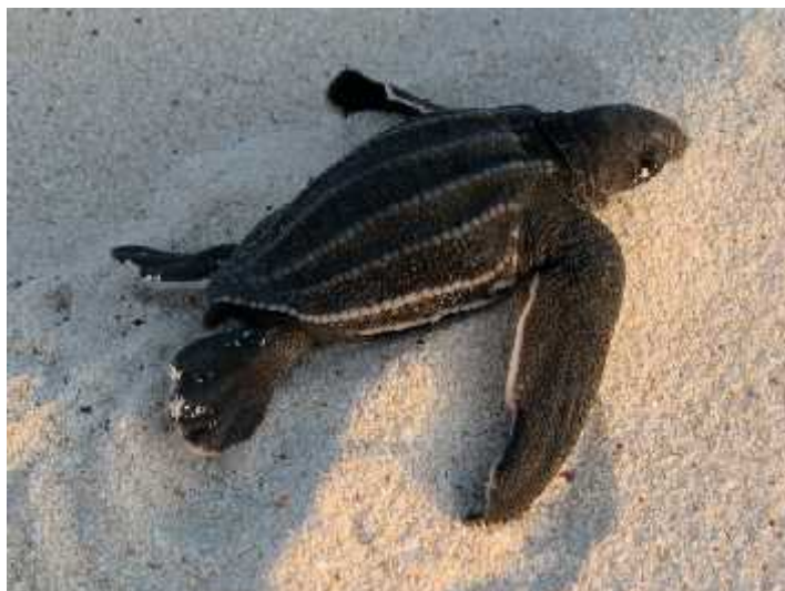
Slika 9. Sedmopruga usminja a

( http://blog.revealedsingularity.net/post/2009/10/07/tuesday-tetrapod-dermochelys-coriacea )