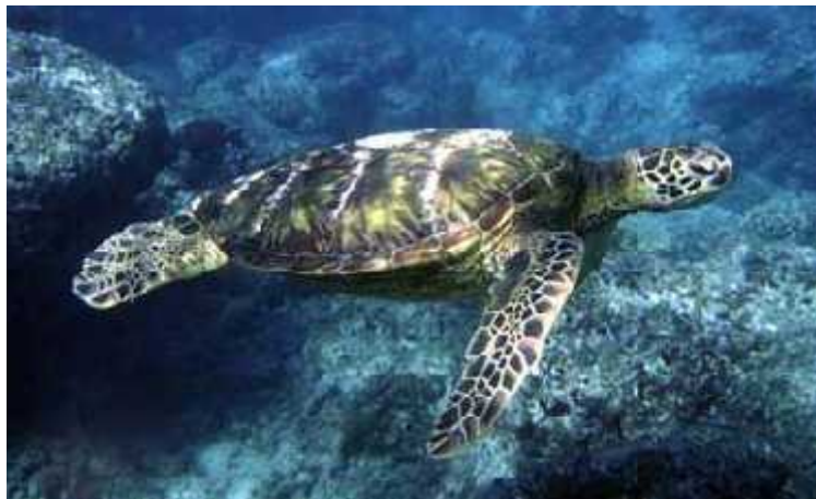
Slika 7. Golema želva

Zelenu želvu nazivamo još i golemom želvom, naravno zbog njene veličine. Ona je najveća morska kornjača iz porodice Cheloniidae. Može težiti do 317 kg dok odrasla jedinka ima oklop dužine i do 150 cm. Ime je dobila po svojem masnom tkivu koje je zelene boje što je rezultat njezine prehrane. To je jedina kornjača koja se hrani morskom travom i algama, čiji je glavni sastav klorofil. Međutim zelene želve na vegetarijansku prehranu prelaze tek u neritim fazama života. Područja ishrane su mjesta sa velikom količinom morskih algi, morskih trava i cvjetnica a nalazimo ih i na područjima koraljnih grebena i stjenovitog dna. Time što pase morsku travu i alge, zelena želva pomaže u očuvanju ove značajne životne zajednice, održavajući je bujnom i zdravom, a time poboljšava kvalitetu života životinja koje tamo obitavaju ( http://www.plavi-svijet.org/hr/kornjace/ ).