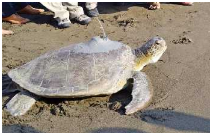
Slika 5. Kornjača sa postavljenim odašiljačem na oklopu ( http://www.hurriyetdailynews.com/sea-turtle-to-be-tracked-with-satellite.aspx?pageID=238&nID=27351&NewsCatID=378 )

Iako je ovaj način puno skuplji istraživači imaju dalje puno više informacija od prve metode. Odašiljači daju točne GPS lokacije kornjače, mjeri dubinu na kojoj kornjača roni, temperaturu okolnog mora... Osim oznaka koje istraživači stavljaju na kornjaču za proučavanje se mogu još i koristiti prirodne oznake na jedinkama, te uzorak rana i ožiljaka na oklopima i perajama ( http://www.plavi-svijet.org/hr/kornjace/ ).