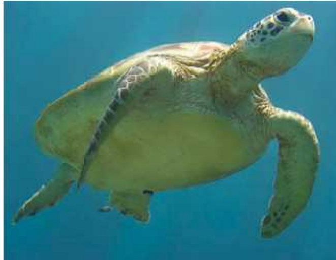
Slika 8. Zelena želva

želvi, zelena želva je jedna od jedine dvije vrste morskih kornja a koje se gnijezde na Mediteranu ime se dodatno nastoji zaštititi jedinke ovih vrsta te ukazati na značaj i očuvanje izvornim i netaknutim obalnim pješkovitim područjima koja morske kornjake koriste za gnijezdenje.