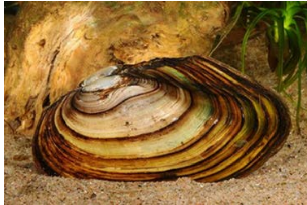
Slika 4. Anodonta anatina