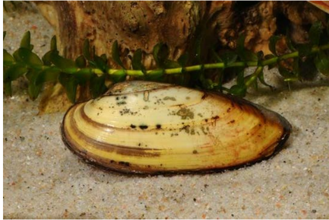
Slika 7. Unio pictorum