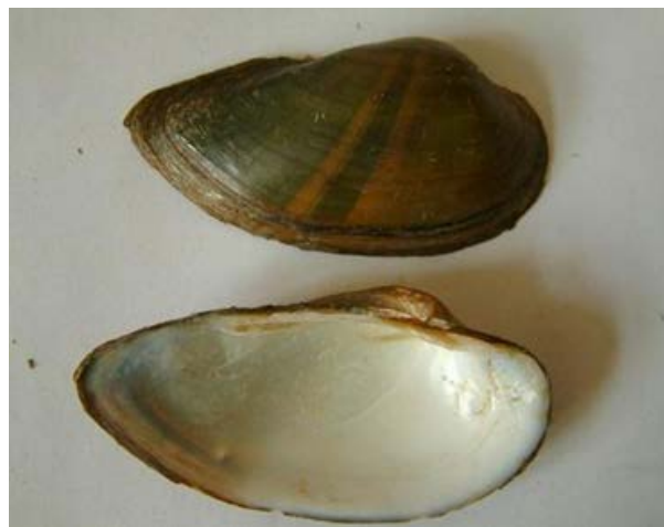
Slika 8. Unio tumidus