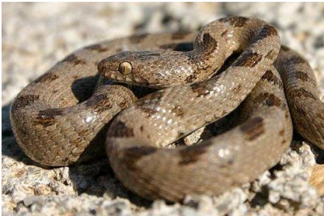
Slika 7. Crnokrpica ( Telescopus fallax )

Zmija vitkog tijela, blago bočno spljoštena, naročito u prednjem dijelu. Može doseći duljinu od 80 cm, rijetko i preko 100 cm. Sivkasta ili smečkasta leđa i bokovi ravnomjerno su isprekidani većim tamnim mrljama koje su naizmjenično raspoređene, dok je trbušni dio svjetliji. Mladi imaju istu obojenost kao i odrasle jedinke. Crnokrpica (sl. 7) ima spljoštenu i izraženu jajoliku glavu te okomite zjenice, iako ne pripada otrovnicama (porodica Viperidae ), već tzv. poluotrovnicama. Njih još nazivamo i stražnježljebozubicama ili opistoglifnim zmijama – otrovni zubi s utorom smješteni su u stražnjem dijelu gornje čeljusti i otrov ulazi u žrtvu žvakanjem. Kod crnokrpica otrov je bezopasan za ljude i služi za svladavanje plijena. (Boulenger 1913; Kreiner 2007).