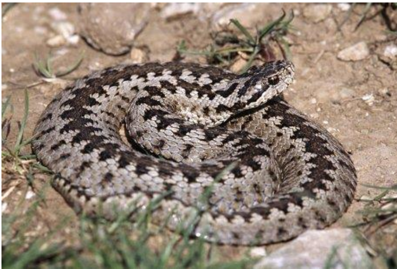
Slika 8. Planinski žutokrug ( Vipera ursinii macrops )

lokaliteti starijih autora na otoku Krku nisu potvrđeni novijim istraživanjima (Jelić i sur. 2012a). Nalaz s područja Vrljike kojeg spominje Kolombatović (1900) se najvjerojatnije odnosi na primjerak planinskog žutokruga (sl. 8) koji se i danas čuva u Prirodoslovnoj zbirci Narodnog muzeja u Zadru, a prikupio ga je Katurić 15.03.1899. na Dinari. Globalni trend je u opadanju zbog izrazito malih i fragmentiranih populacija te ubrzanog nestanka povoljnih travnjačkih staništa. U Hrvatskoj su populacije u blagom opadanju, primarno zbog smanjenja povoljnih staništa (Jelić i sur. 2012b).