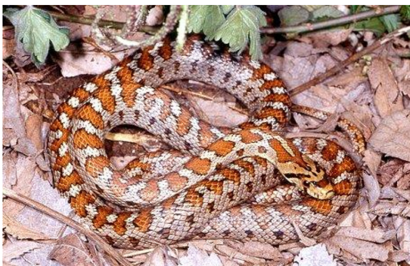
Slika 6. Crvenkrpica ( Zamenis situla )

Crvenkrpica (sl. 6.) je zmija vitkog tijela i uske glave, prosječna duljina tijela je od 60–100 cm. Temeljna boja je siva ili crvenkastosiva (može biti i žućkastosiva te zelenkastosiva) s velikim crvenosmeđim pjegama (pjegavi morfološki tip) ili prugama (prugasti morfološki tip) koje imaju crni obrub. Naizmjenično s leđnim mrljama s obje strane tijela, niže se niz manjih crnih, većinom poprečnih, mrlja. Na glavi s gornje strane gotovo uvijek postoje crne ili smeđe poprečne trake, a na zatiljku je tamna zatiljna mrlja iza koje počinje niz tamnocrvenih ili smeđih mrlja. Kod prugastih se oblika leđne mrlje niz hrbat postupno stapaju u dvije pruge koje se protežu do vrha repa. Oba morfološka tipa možemo naći u mnogim populacijama u različitim omjerima, iako je prugasta forma obično dosta rjeđa. Mlade jedinke imaju obojenost kao i odrasle jedinke (Jelić i sur. 2012b).