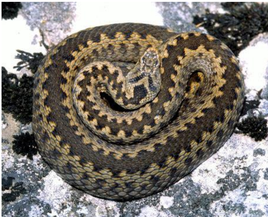
Slika 9. Riđovka ( Vipera berus )

U Hrvatskoj dolazi pretežno u kontinentalnim krajevima (dolina Save, Drave i Dunava), Gorskom kotaru te na pojedinim dijelovima lanca Dinare (masiv Troglava) na granici s Bosnom i Hercegovinom (Jelić i sur. 2009, 2012a). U Hrvatskoj je riđovka (sl. 9) zastupljena s dvije podvrste, V. b. berus koja naseljava samo brdska i planinska područja Gorskog kotara te V. b. bosniensis koja naseljava ostatak areala (kontinentalne nizine Save, Drave i Dunava te visokoplaninska staništa na Troglavu) (Ursenbacher i sur. 2006; Jelić i sur. 2009). Populacije iz Gorskog kotara u Hrvatskoj te populacije u sjevernoj Italiji i Sloveniji čak se smatraju i odvojenom "talijanskom filogenetskom linijom" od nominalne podvrste V. b. berus (Ursenbacher i sur. 2006). Ova linija još nije opisana kao zasebna podvrsta. U Hrvatskoj su brdske i planinske populacije u Gorskom kotaru i na Troglavu stabilne, dok su nizinske populacije u značajnom padu primarno zbog nestanka staništa (Jelić i sur. 2009).