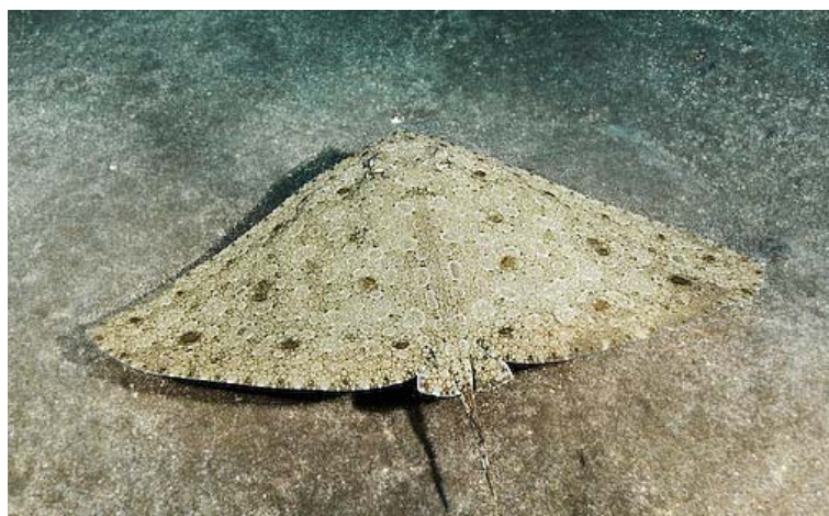
Slika 7. LEPTIRICA ( Gymnura altavela )

Osim golubovki i žutuga još jedna razlika riba ima otrovnu bodlju na repu. To je leptirica (Slika 7.) ili pazdrk koja može narasti do 2,9 m međutim promjer krila joj je veći od 4 m. Ukupna težina do 60 kg. Pripada porodici Gymnuridae koje se od drugih skupina razlikuju po veličini krila koja su im i dva puta duža nego dužina tijela od vrha repa do glave. Živi do 100 m dubine na mekanim dnima u koje se zakopava. Bentoska je i sedentarna vrsta. Obitava u istočnom Atlantiku i cijelom Mediteranu, te u Jadranu, iako je dosta rijetka. Žućkasto-sive i mramorne je boje, a sa donje strane bijelo crvene. Po obliku glave i nedostatku leđne peraje je bliže opisu žutuljama. Rep je kratak, a uz sam početak smještena je kratka nazubljena bodlja. Otroavno žljezdano tkivo nalazi se u uzdužnom žlijebu bodlje. Kratki rep ne može obuhvatiti žrtvu. Smještaj uz samo tijelo onemogućuje zamahivanje bodljom (Wöfl, 1994).