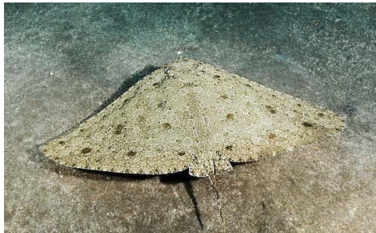
Slika 7. LEPTIRICA ( Gymnura altavela )

Osim golubovki i žutuga još jedna razlika riba ima otrovnu bodlju na repu. To je leptirica (Slika 7.) ili pazdrk koja može narasti do 2,9 m međutim promjer krila joj je veći od 4 m. Ukupna težina do 60 kg. Pripada porodici Gymnuridae koje se od drugih skupina razlikuju po veličini krila koja su im i dva puta duža nego dužina tijela od vrha repa do glave. Živi do 100 m dubine na mekanim dnima u koje se zakopava. Bentoska je i sedentarna vrsta. Obitava u istočnom Atlantiku i cijelom Mediteranu, te u Jadranu, iako je dosta rijetka. Žućkasto-sive i mramorne je boje, a sa donje strane bijelo crvene. Po obliku glave i nedostatku leđne peraje je bliže opisu žutuljama. Rep je kratak, a uz sam početak smještena je kratka nazubljena bodlja. Otroavno žljezdano tkivo nalazi se u uzdužnom žlijebu bodlje. Kratki rep ne može obuhvatiti žrtvu. Smještaj uz samo tijelo onemogućuje zamahivanje bodljom (Wöfl, 1994).