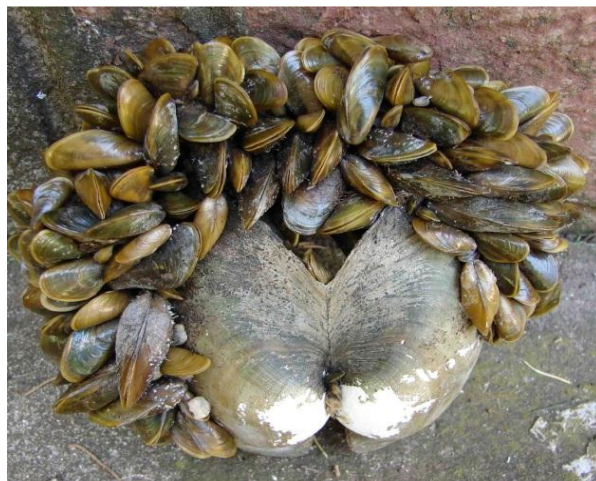
Slika 5. Obraštaj vrste Limnoperna fortunei na autohtonom školjkašu Unionidae

L. fortunei s velikom brojnošću nastanjuje autohtone školjkaše ( Hyriidae i Mycetopodidae ), uzrokujući njihovo izgladnjivanje i gušenje, te u konačnici i uginuće. Od invazije, izmijenila se prisutnost i brojnost nekoliko vrsta autohtonih makrobekralješnjaka, homogeniziralo se stanište i nekoliko vrsta riba promjenilo je svoju prehranu kako bi konzumirale velik broj ovih mekušaca. Utvrđena je sličnost između vrsta Dreissena polymorpha i L. fortunei , te se smatra da bi L. fortunei mogla imati čak i veći učinak na okoliš od D. polymorpha . Filtracijska aktivnost L. fortunei snažno utječe na stope mineralizacije nutrijenata, dostupnost kisika i stope sedimentacije. Visoke stope filtracije ove vrste mogu reducirati zalihe fitoplanktona i biomasu, potisnuti zooplanktonske populacije, biti uspješnije u kompeticiji za raspoloživu hranu sa autohtonim vrstama, povećati sedimentacijske stope i izmijeniti kruženje kontaminanata i nutrijenata (Garcia i Protogino, 2005).