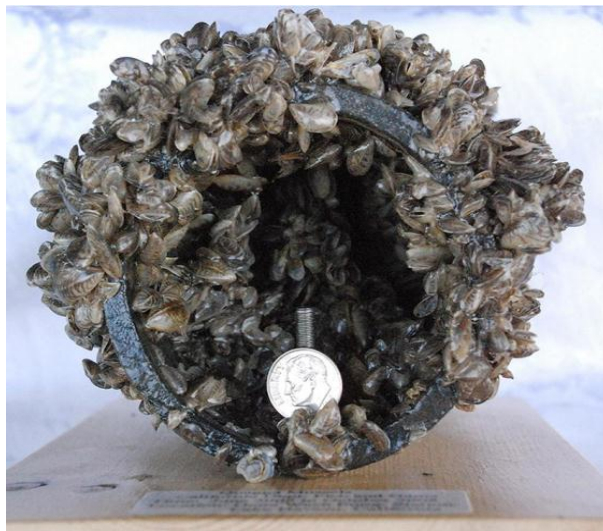
Slika 3. Vodovodna cijev s obraštajem školjkaša Dreissena polymorpha

Guste nakupine praznih ljuštura školjkaša umanjuju rekreacijske i estetske vrijednosti plaža. Obrastanja odvoda i usisnih struktura cjevovoda (Sl. 3.) u vikendicama je postalo uobičajeno i prisililo je "vikendaše" da razviju strategije otvaranja i zatvaranja na godišnjoj razini. Preporučuje se održavanje i zaštita tri glavne komponente: usisne strukture (ventila), sustava za isporuku (cijevi i cjevovodi) i same vikendice (Mackie i Claudi, 2009).