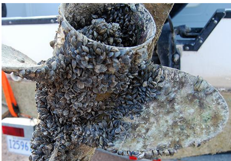
Slika 2. Propeler broda s obraštajem školjkaša Dreissena polymorpha

Trupovi i motori brodova i čamaca obrašteni su s Dreissena polymorpha pa je umanjena njihova plovidbena učinkovitost (Sl. 2.). Navigacijska pomagala, kao što su ribarske plutače i markeri, imaju tako teške infestacije da tonu ispod površine. Također mogu biti pogođeni i sustavi hlađenja na plovilima (Claudi i Mackie, 1994).