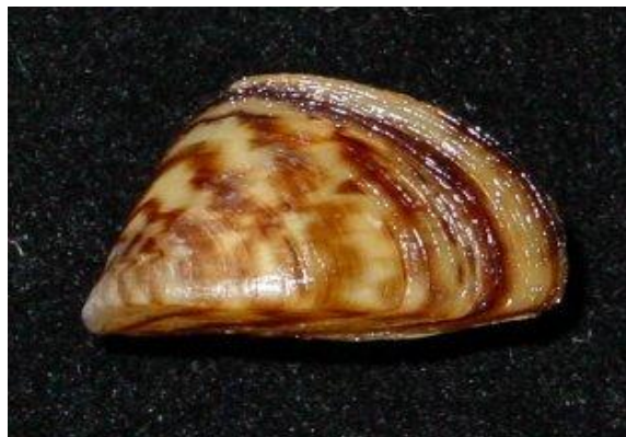
Slika 1. Vrsta Dreissena polymorpha

Raznolika trokutnjača, Dreissena polymorpha (Pallas, 1771) diljem svijeta je poznata po svojim invazivnim karakteristikama (Hebert i sur., 1989; Nalepa i Schloesser, 1992). Naziv polymorpha dobila je zbog izrazito varijabilne ljušture čiji oblik, boja i veličina ovise o supstratu, dubini vode i gustoći naslaga koje tvori. Ljuštura je trokutastog oblika s ravnom ventralnom površinom koja omogućuje bolje prijanjanje za supstrat, te zašiljenom dorzalnom površinom oblika šatora. Englesko ime vrste "zebra mussel" po kojemu je poznata u svijetu, dobila je zbog tamno smeđih i bijelih pruga koje mogu imati cik-cak raspored, ili biti ravne (Birnbaum, 2011) (Sl. 1.).