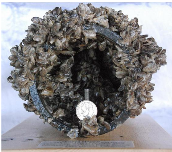
Slika 3. Vodovodna cijev s obraštajem školjkaša Dreissena polymorpha

Guste nakupine praznih ljuštura školjkaša umanjuju rekreacijske i estetske vrijednosti plaža. Obrastanja odvoda i usisnih struktura cjevovoda (Sl. 3.) u vikendicama je postalo uobičajeno i prisililo je "vikendaše" da razviju strategije otvaranja i zatvaranja na godišnjoj razini. Preporučuje se održavanje i zaštita tri glavne komponente: usisne strukture (ventila), sustava za isporuku (cijevi i cjevovodi) i same vikendice (Mackie i Claudi, 2009).