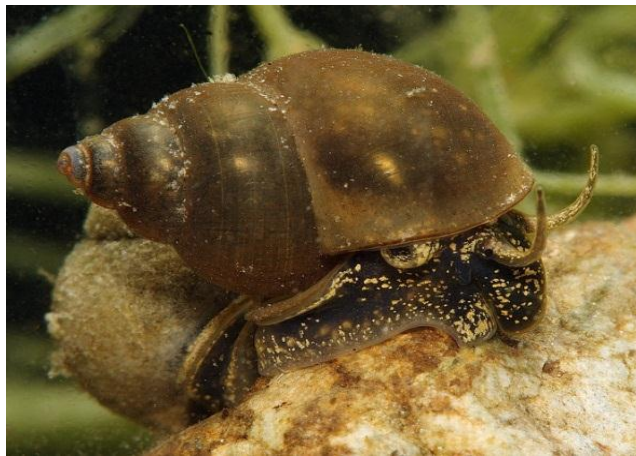
Slika 8. Vrsta Bithynia tentaculata

Nativno područje rasprostranjenosti slatkovodnog puža Bithynia tentaculata (Linnaeus, 1758) (Sl. 8.) je Europa i zapadni dio Sibira. Kao i većina puževa, hrani se algama struganjem sa čvrste površine, no ono što ga čini različitim od drugih vrsta puževa je sposobnost filtriranja vode pomoću ktenidija. Nastanjuje područja sporijeg toka vode, koje je bogato kisikom i mineralnim tvarima. Najviše mu pogoduje muljeviti supstrat, ali se lako prilagodi i na kamenitu, odnosno pjeskovitu podlogu (Tashiro i Colman, 1982).