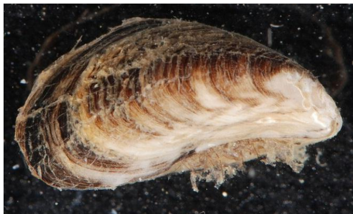
Slika 4. Vrsta Mytilopsis leucophaeata

M. leucophaeata uzrokuje veliku ekonomsku štetu industriji - stvara obraštaje, odnosno remeti hlađenje vodenih sustava industrijskih i energetske postrojenja. Idealno stanište za tu vrstu su cjevovodi rashladnog sustava elektrane jer pružaju savršene uvjete za rapidni rast, što u konačnici ometa rad i normalno funkcioniranje sustava. Njezina brza reprodukcija u takvom idealnom okruženju može dovesti do razvoja ekstremno gustih populacija koje začepuju cijevi, sprečavajući strujanje vode te time mogu oštetiti ili uzrokovati kvar na sustavima. Konkretni primjeri takvog obraštaja poznati su iz Belgije, Finske i Nizozemske s gustoćom u rasponu od nekoliko desetaka tisuća do čak milijuna jedinki/m 2 . M. leucophaeata također obrašta čamce, užadi, kaveze i drugu brodsku opremu te je u kompeticiji s drugim organizmima koji se hrane filtriranjem (Mackie i Claudi, 2009). Osim obraštanja, guste populacije M. leucophaeata mijenjaju ekosustave i vjerojatno imaju značajne ekološke učinke slične onima koje ima D. polymorpha , a koji zahtijevaju daljnja istraživanja. Zbog svega navedenog, bitno je rano otkrivanje i sprječavanje naseljavanja M. leucophaeata , osobito u industrijskim pogonima rashladnih sustava (URL 5).