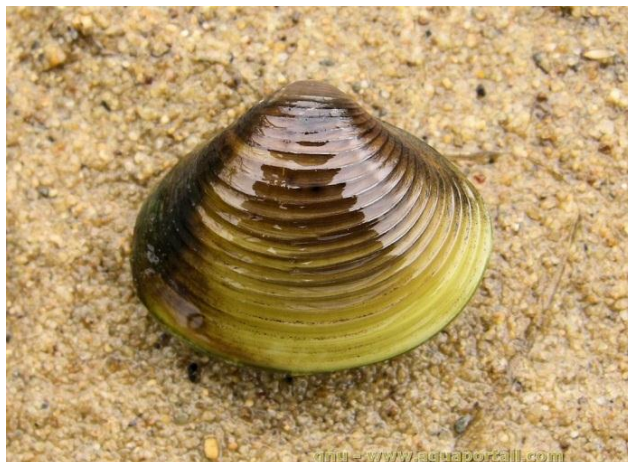
Slika 6. Vrsta Corbicula fluminea

Krupnorebrasta kotarica, Corbicula fluminea (O. F. Müller, 1774) (Sl. 6.) je školjkaš koji je prvi put zapažen 1920. godine na obalama Pacifika, SAD. Pretpostavlja se da je došao brodovima kojima su plovili kineski imigranti, a u Europi ju je prvi uočio Mouthon 1981. godine (Sousa i sur., 2008). Prirodno stanište ovog školjkaša nalazi se u tropskim i suptropskim područjima Afrike, Azije, Malajskog arhipelaga, Filipina, Nove Gvineje i istočne Australije (Ciutti i Cappelletti., 2009). Razvija se uglavnom na fino zratom (pjeskovitom) supstratu, često na dubinama od 5 do 6 metara. Hrani se filtriranjem riječne vode (Pigneur i sur., 2011). Prema pojedinim autorima ova vrsta ima najveću neto produkciju u odnosu na bilo koju drugu vrstu slatkovodnih školjkaša. Ima visok fekunditet, ali nisku stopu preživljavanja juvenilnih jedinki te visoku stopu smrtnosti tijekom života (Sousa i sur., 2008).