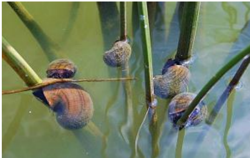
Slika 7. Hranjenje Pomacea insularum sadnicama riže

predstavlja prijetnju za floridskog puža Pomacea paludosa kao i na vrste koje se oslanjaju na njega za prehranu (Rawlings i sur., 2007). Nedavne studije pokazale su da veličina oštećenja usjeva ovisi o tehnici rasta riže (Burlakova i sur. 2008). Puž oštećuje sadnice riže (Sl. 7.) u korelaciji s dubinom vode na terenu, a šteta se smanjuje što su sadnice starije. Porast sadnica u roku od dva do pet tjedana rezultirao je značajnim smanjenjem štete uzrokovane puževima (Burlakova i sur. 2008).