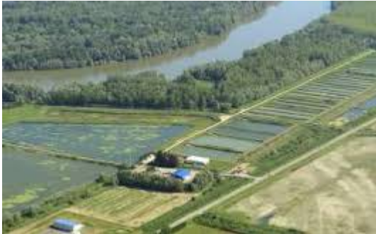
Slika 3. Moderno ribnjačarstvo (Izvor 3)

To je hidrograđevinski objekt za kontrolirano razmnožavanje i uzgoj riba kojeg se prema potrebi može isprazniti i napuniti vodom. (Sl.3.) Ovaj hidro građevinski objekt sastoji se od nasipa, ispusta i upusta.