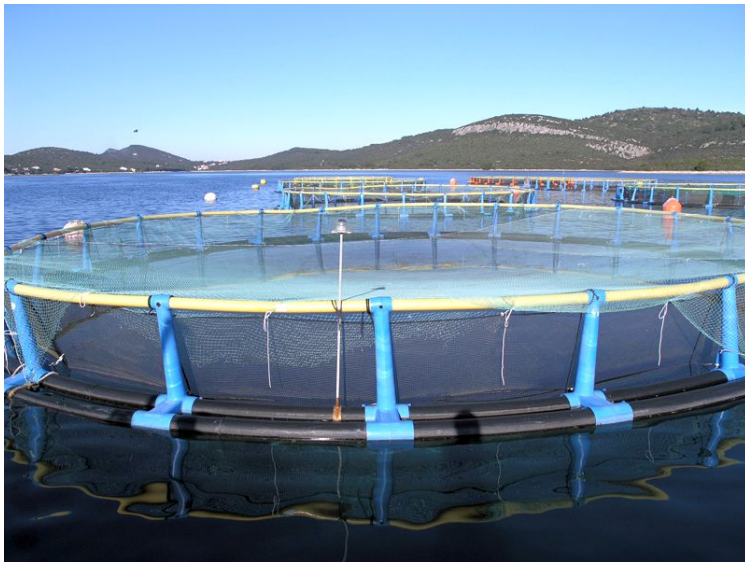
Slika 1. Kavezi u marikulturi (Izvor 1)

U našim uvjetima uzgojni ciklus traje od 18-24 mjeseca u kojem se, stalnim kontrolama, prati zdravstveno stanje i prirast. Redovito se kontrolira ima li uginule ribe, a također se vodi računa o higijeni mreža i pribora. Izlov se radi u skladu s planiranim plasmanom na tržište. ( http://www.ss-veterinarska-zg.skole.hr/ )