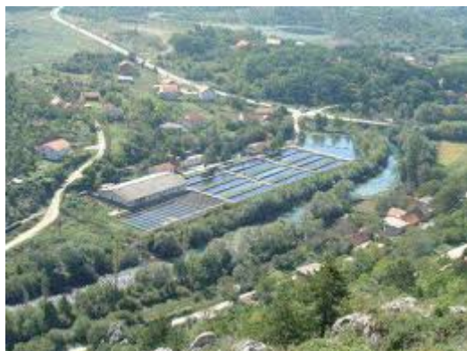
Slika 4. Pastrvsko ribogojilište u Kninu

Proizvodnja pastrvskih riba ponajprije uključuje uzgoj kalifornijske pastrve, no osim nje uzgaja se i potočna pastrva. Potrebne su velike količine čiste, bistre i hladne vode s velikom količinom kisika. Uzgoj je najpovoljniji na izvoru i potoku kratkog toka s optimalnom temperaturom 8-15°C i s količinom kisika iznad 10 mg/L. Prema načinu protoka vode razlikujemo četiri osnovna sustava. Prvi je sustav jednostrukog iskorištavanja protoka, kad su bazeni postavljeni paralelno i u svaki od njih ulazi voda iz dovodnog kanala. Sljedeći je sustav višestrukog iskorištavanja protoka u kojem voda iz dovodnog kanala ulazi najprije u gornje bazene. U poluzatvorenom protoku je takav sustav kod kojeg se dio vode nakon upotrebe pročišćava. Zadnji je zatvoreni sustav protoka u kojem se stalnom cirkulacijom i pročišćavanjem koristi ista voda i nadoknađuje se tek mali dio koji isparava. Najveća pastrvska ribogojilišta su Krčić u Kninu koji se nalazi u neposrednoj blizini izvora rijeke Krke i ribogojilište Leko na rijeci Gacki. (Sl. 4.)