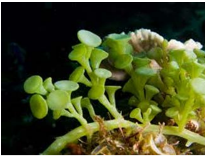
Slika 9. Invazivna zelena alga Caulerparacemosa

Jedan od razloga ugroženosti su i invazivne vrste, među kojima je najpoznatija invazivna zelena alga Caulerparacemosa (Slika 9.).