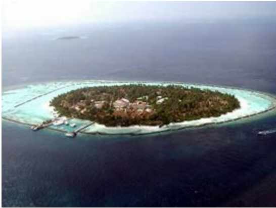
Slika 3. Rubni koraljni greben u Maldiviji

a) rubni koraljni grebeni – oblikuju koraljni rub oko tropskog otoka ili duž dijela obale velike kopnene mase (Slika 3.). e. Između grebena i obale ima jako malo laguna ili ih nema uopće. To je najčešća vrsta grebena, a sastoji se od nekoliko pojaseva.