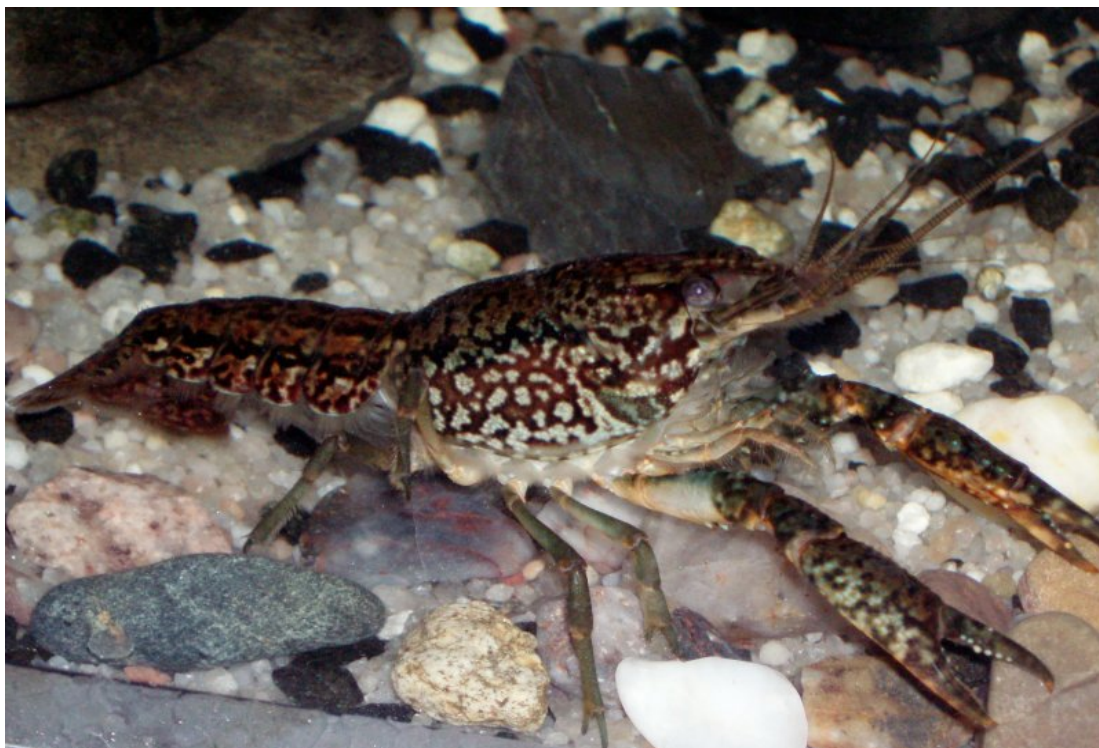
Slika 2. Mramorni rak

Mramorni rak, Procambarus fallax f. virginalis (Sl. 2.) je prvi put u Europi zabilježen 90-tih godina prošlog stoljeća u Njemačkoj, gdje se uzgajao kao akvaristička vrsta (Werner 1998). Vjeruje se da je u prirodna staništa pušten namjerno ili slučajno od strane akvarista, a njegovu prisutnost u divljini su 2003. godine utvrdili Scholtz i sur. Ova je vrsta lako prepoznatljiva po mramoriranoj obojenosti tijela, a jedinstvena je među slatkovodnim deseteronožnim rakovima po partenogenetskom razmnožavanju. Zbog svog uzorka na tijelu prozvan je mramorni rak. Jedinke mramornog raka nađene su u prirodi i u lotičkim i u lentičkim slatkovodnim sustavima. No Chucholl i Pfeiffer (2010) smatraju da mogu kolonizirati samo tople lentičke ekosustave ljeti, a najviše uspostavljenih populacija ove vrste u Europi nađeno je u šljunkovitim jezerskim ekosustavima (Chucholl i sur. 2012).