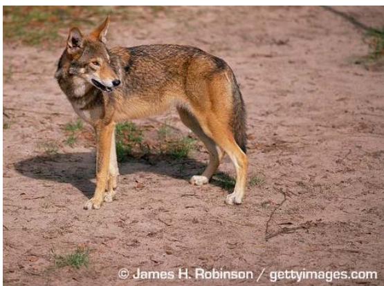
Slika 4. Crveni vuk (slika: James H. Robinson)

Crveni vuk obično je veći od kojota, no manji od sivog vuka, dugačkih je nogu i velikih ušiju. Njuška mu je široka, a oči bademaste, što pridonosi vučjem izgledu (slika 4.). Krzno mu je smečkaste boje sa sivim i crnim oznakama na leđima i repu. Pretežno su noćne životinje s najvišom aktivnosti u sumrak i zoru kada love manji plijen poput nutrija, zečeva, rakuna, no hrane se i većim plijenom poput jelena. Primjećen je solitarni lov, ali i lov u čoporu. Manji plijen češće konzumiraju mlađi članovi čopora (Philips i sur. 2003), što je karakteristika vukova, ne kojota.