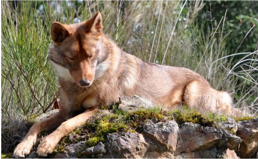
Slika 5. Hibrid psa i kojota

djelovima SAD-a zakonski je dozvoljeno imati ih kao kućne ljubimce, no s njima se teško može postupati, što je očekivano za životinju koja sadrži DNA potpuno divlje vrste.