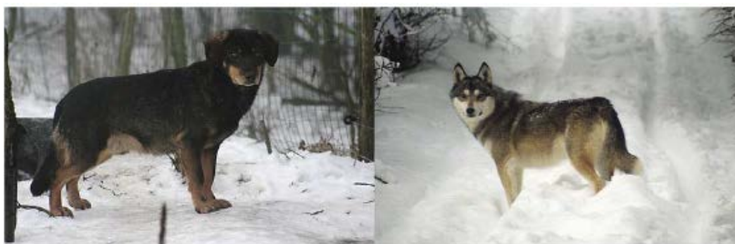
Slika 3. Dva hibrida psa i vuka F_1 generacije (Hindrikson i sur. 2012)

Zabilježene su bihevioralne karakteristike divljih hibrida koje potječu od psa, poput promiskuitetnijeg parenja bez formiranja parova te slabe uključenosti mužjaka u odgajanje štenaca koji otežavaju integraciju hibrida u vučju populaciju. Dodatan problem su razdoblja estrusa koja su kod hibridnih ženki pomaknute za 2 mjeseca, iz veljače u prosinac (Mengel 1971; Silver i Silver 1969). Ako uspiju pronaći partnera i pariti se, oštenit će se zimi umjesto u proljeće, što može povećati mortalitet u hladnijim regijama (Adams i sur. 2003). Postoji primjer introgresije psećih alela boje krzna ( k lokus) u populacije sivog vuka u Kanadi i kojota u jugoistočnom SAD-u koji uzrokuje melanističku obojenost (Anderson i sur. 2009). Alel se održao, iako nije poznato koja je točno prednost njome dobivena, no pretpostavlja se da je adaptacija na ekološke uvjete (Coulson i sur. 2011; Musiani i sur 2007). Proučavanjem uzgojenih hibrida utvrđeno je da su često asocijalni, agresivniji i manje plašljivi od pasa te imaju izraženiji lovački instinkt, zbog čega su hibridi s višim postotkom vučje krvi često preveliki izazov vlasnicima i završe na ulici.