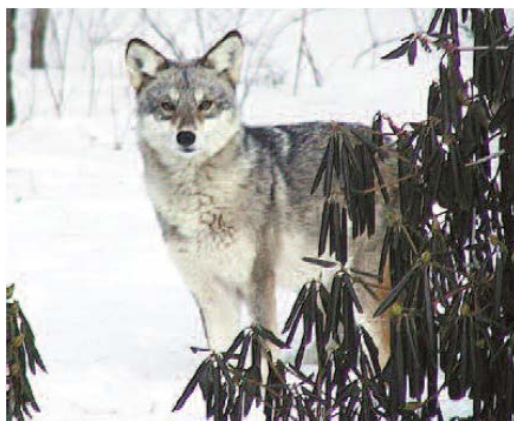
Slika 2. Istočni kojot (hibrid kojota i istočnog vuka) (Way, 2013)

Prehrana istočnog kojota sadrži više većeg plijena poput jelena nego što je uobičajeno kod ostalih kojota. Lubanje su im šire s većim područjima za prihvaćanje žvačnih mišića, što povećava silu zagriža i omogućava svladavanje masivnijih životinja. Boja krzna istočnog kojota varira od pretežito bijele boje na glavi do tamnosmeđe-sive, crvene, svjetlosmeđe i sive boje (slika 2.) (Way 2013). Chambers (2010) odbija naziv „coywolf“ koji predlaže Way zbog implikacije da je podjednak udio genetičkog materijala roditeljskih vrsta, što je netočno. Populacije istočnog kojota su heterogenijeg sastava, no više sadrže kojotske DNA, stoga predlaže pojednostavljeni naziv „kojot“ ili „sjeveroistočni kojot“.