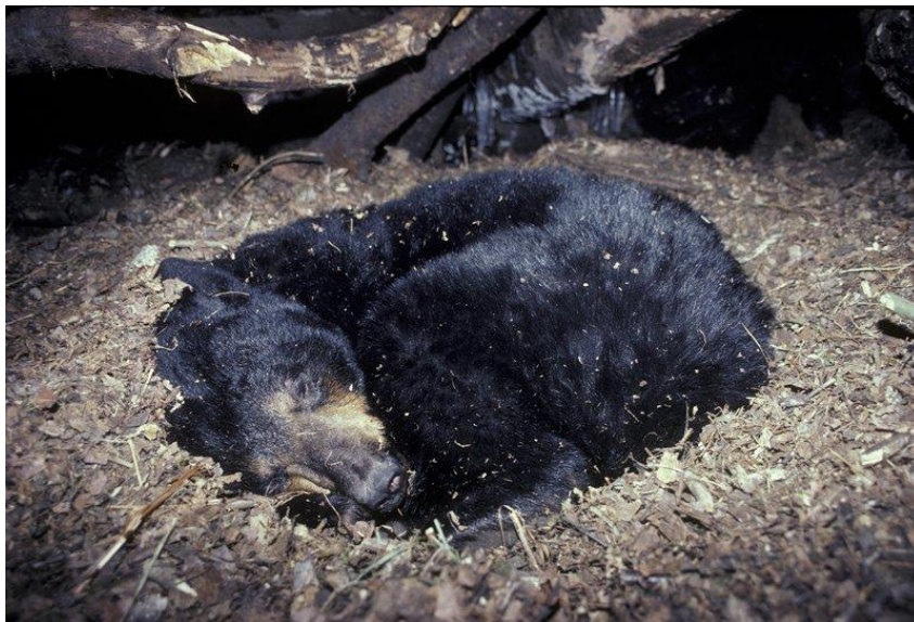
Slika 2. Crni medvjed tijekom hibernacije.

Još i danas rašireno je pogrešno navođenje medvjeda kao klasičnog primjera pravog hibernatora. Donedavno, medvjedi se nisu smatrali hibernatorima jer, iako im se tjelesna temperatura snizi tijekom zimskih mjeseci, ona ostaje na vrijednosti iznad 30°C, što je značajno više od temperature okoliša, čime oni ne ispunjavaju osnovne kriterije hibernacije. Ipak, prilikom istraživanja crnog medvjeda ( Ursus americanus ) otkriveno je da ima slične mehanizme snižavanja stope metabolizma kao i pravi hibernatori, kojima stopu metabolizma može sniziti čak na ¼ bazalne. Iako crni medvjedi radi tjelesne veličine i, proporcionalno njoj, dugog vremena ponovnog zagrijavanja tijela, ne mogu sniziti tjelesnu temperaturu jednakom efikasnošću kao pravi hibernatori, radi pokazanih mehanizama regulacije metabolizma svrstavaju se u specijalizirane hibernatore. U tu skupinu zasad spada samo jedna vrsta medvjeda (Slika 2), dok kod ostalih ovakvi mehanizmi nisu uočeni i za njihovo je mirovanje još uvijek pravilan termin letargija ili zimski san, a ne hibernacija. (Hill i sur., 2012)