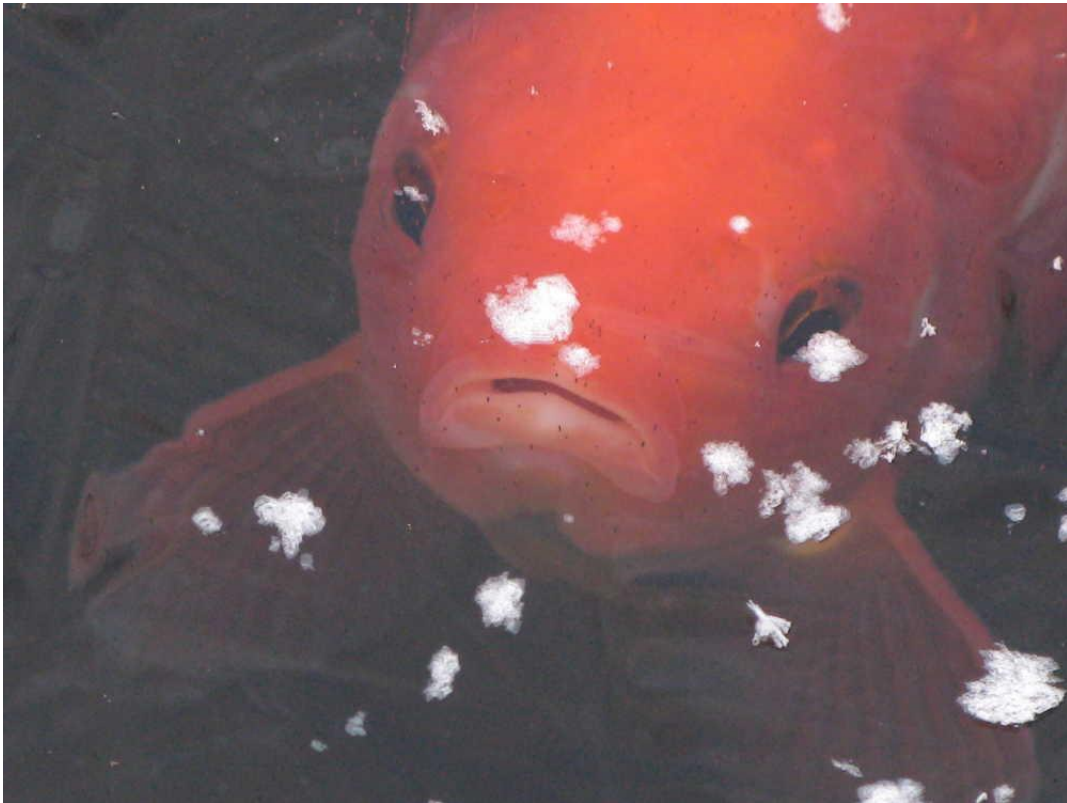
Slika 1. Zlatna ribica ispod sloja leda.

Hibernacija se razlikuje od ostalih oblika mirovanja u tome što ju mogu vršiti samo homeotermni organizmi, odnosno oni koji imaju sposobnost da u određenim uvjetima aktivno i kontrolirano snize svoju tjelesnu temperaturu gotovo do one vanjske. U okviru hibernacije nalaze se brojni ekstremni primjeri preživljavanja niskih temperatura s posljedicama drastičnog pada tjelesne temperature, težine i stope metabolizma, a kako se javlja većinom kod sisavaca, ljudima je najbliži i najzanimljiviji od navedenih fenomena. (Sherwood i sur., 2013)