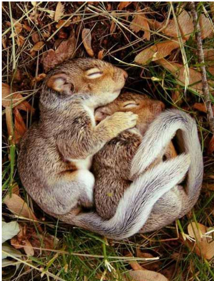
Slika 3. Vjeverice u hibernaciji.

Iako se razlikuju u vremenu pripreme, svim skupinama zajednički su fiziološki procesi koji se odvijaju kako bi došlo do uspostave kontrolirane hipotermije, koja obilježava ulazak u hibernaciju. Do otprilike 20 godina unazad univerzalno mišljenje bilo je da sve hibernirajuće životinje prilikom ulaska u hibernaciju aktivnošću hipotalamusa jednostavno inaktiviraju termoregulacijski sustav. Smatralo se da je to prvi korak, nakon kojeg tjelesna temperatura pada zajedno s hlađenjem okoliša jer ju životinja više ne može regulirati, a finalna posljedica je smanjena stopa metabolizma radi hlađenja tkiva. Novija istraživanja ustanovila su da se kod nekih hibernatorskih vrsta prvo događa biokemijski regulirano smanjenje stope metabolizma, također djelovanjem hipotalamusa, te da se tjelesna temperatura zatim posljedično snizi. (Hill i sur., 2012)