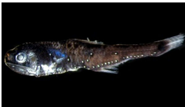
Slika 7. Žaboglav trnasti ( Myctophum asperum )

Pripada redu Myctophiformes. (Slika 7.) Jedna je od najbrojnih dubokomorskih vrsta riba i važna spona u oceanskom hranidbenom lancu. Jedu planktonske račiće, a njih jedu tuljani i veće ribe. Imaju svjetleće organe na glavi i tijelu. Različit raspored ili veći svjetleći organi blizu repa pokazuju je li riba mužjak ili ženka. (Borovac, 2001.)