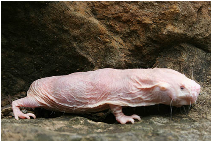
Slika 2. Vanjski izgled golokrtičjeg štakora ( Heterocephalus glaber )

Golokrtičji štakor ( Heterocephalus glaber ) je eusocijalni dugoživući podzemni glodavac koji potječe iz područja Roga Afrike. Dug je 8-10 centimetara, ima smežuranu blijedo roskastu boju kože te velike prednje zube (slika 2.).