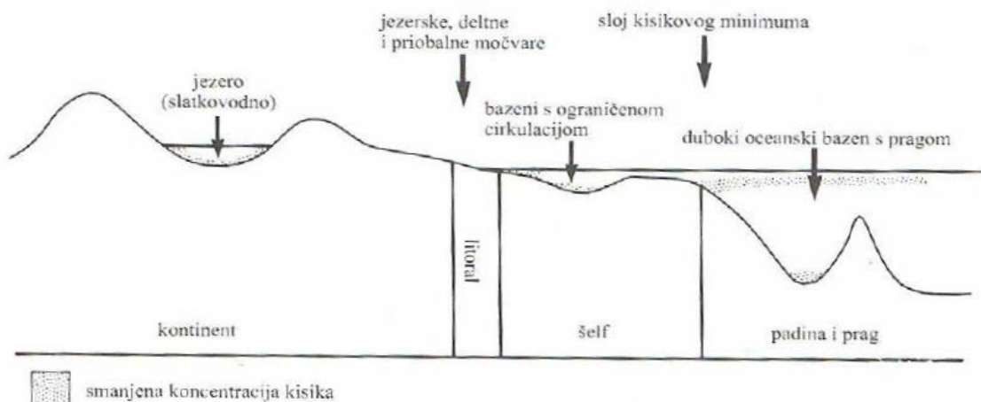
Slika 1. Najvažniji okoliši za nastanak matičnih stijena ugljikovodika (Barić, 2006).

Najbolji okoliši za nastanak matičnih stijena ugljikovodika su plitki vodeni okoliši gdje postoji velika produkcija organske tvari, jaka sedimentacija i sloj vode s vrlo malo kisika (Libes, 2009). Prema tome, u najvažnije okoliše za nastanak matičnih stijena ubrajamo slatkovodna jezera, lagunska, deltna i priobalna močvarna područja, šelfove s ograničenom cirkulacijom te bazene s padinama i pragovima (Barić, 2006) (slika 1).