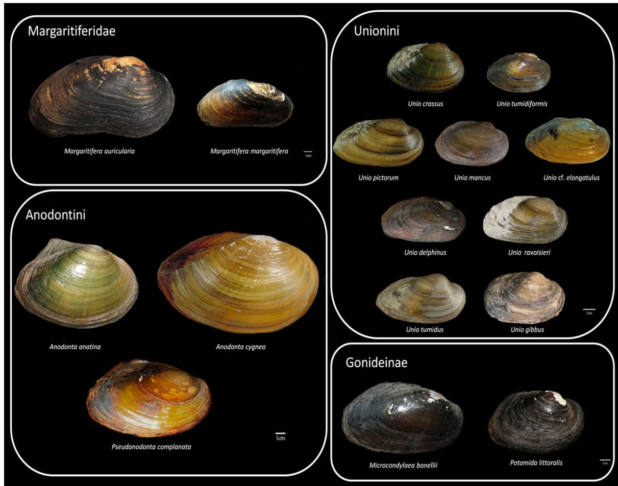
Slika 1. Ljušture europskih slatkovodnih školjkaša (Lopes-Lima i sur., 2016)

Slatkovodni školjkaši imaju specifičan način razmnožavanja u kojemu ženka čuva svoja jaja u marsupiju (modificirane škrge). Do oplodnje dolazi tako da sperma pomoću mlaza ulazne vode ulazi u plaštanu šupljinu i oploduje jajašca. Iz njih se izlegu parazitske ličinke glohidije koje ženke izbacuju van te potom kreću u potragu za ribom domaćinom. Domaćina moraju pronaći u roku od nekoliko dana, u protivnom ugibaju. Nedostatak ovog načina razmnožavanja je da glohidije nemaju nikakvu sposobnost pokretanja što uvelike smanjuje pronalazak domaćina i povisuje mortalitet ličinki (Lefevre i Curtis, 1910). Unatoč tome, ovaj stadij, osim što uvelike pomaže rasprostiranju školjkaša obitavajući na škragama, operkulumu ili perajama riba, pridonosi kontinuiranom izvoru nutrijenata koji je neophodan za razvoj mladog školjkaša (Denic i sur., 2015). Nakon prihvaćanja za domaćina, glohidije bivaju obavijene mjehurićem koji nastaje kao posljedica imunosne reakcije ribe domaćina te doživljavaju metamorfozu. Nakon nekoliko tjedana postaju mlade jedinice i otpuštaju se s domaćina te padaju na dno gdje, u ovome stadiju, ukopane u supstratu provedu i do nekoliko godina dok u potpunosti ne postanu spolno zrele odrasle jedinice (Slika 2) (Coker i sur., 1921).