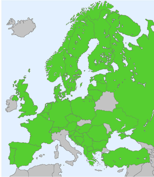
Slika 3. Rasprostranjenost vrste prema bazi Fauna Europea (www.faunaeuropa.org)