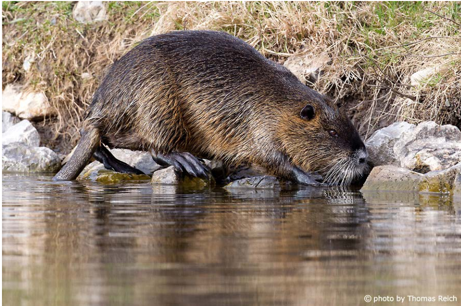
Slika 1. Myocastor coypus (nutrija )

Invazivne vrste danas su jedna od najvećih prijetnji bioraznolikosti. Nutrija ( Myocastor coypus ) spada u 100 najinvazivnijih vrsta u svijetu. Nutrija (Sl. 1) je veliki semiakvatički glodavac koji se uglavnom hrani vodenom vegetacijom, a time ugrožava brojne druge vrste. Podrijetlom je iz Južne Amerike, a u ostatak svijeta unesena je za potrebe proizvodnje krzna na farmama početkom 20. stoljeća. Ubrzo počinje naseljavati divljinu gdje osniva samoodržive populacije. Jedina dva kontinenta nenaseljena nutrijom su Australija i Antarktika. Štete koje nutrija izaziva su brojne, osim utjecaja na ekosustave i autohtone vrste, nutrija utječe i na obale rijeka, nasipe, poljoprivredu i sustave navodnjavanja te uzrokuje brojne materijalne štete. Mjere koje se poduzimaju podrazumijevaju mjere kontrole populacije i mjere eradikacije kojima se broj jedinki na nekom prostoru svodi na nulu. Nekolicina zemalja pokušala je iskorijeniti nutriju provodeći ovakve mjere. U Ujedinjenom Kraljevstvu 80-tih godina prošlog stoljeća provedene su mjere eradikacije, dok se u Italiji provode mjere kontrole populacije.