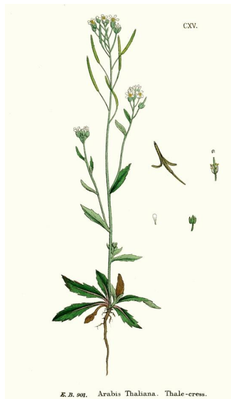
Slika 1. Arabidopsis thaliana.

Vrsta A. thaliana (Slika 1) spada u obitelj Brassicaceae koja je široko rasprostranjena u cijeloj Europi, Aziji i Sjevernoj Americi. Mnogo različitih ekotipova je prikupljeno iz prirodnih populacija te su dostupni za eksperimentalnu analizu. Ekotipovi Columbia i Landsberg su prihvaćeni kao standardi za genetička i molekularna istraživanja. Cijeli životni ciklus, uključujući klijanje sjemenki, formiranje rozete, cvatnju i sazrijevanje prvih sjemenki, je završen nakon 6 tjedana [8]. Iako usko povezana sa gospodarski važnim poljoprivrednim kulturama kao što su repa, kupus, brokula i uljana repica, uročnjak nije ekonomski važna biljka. Unatoč tome, objekt je genetičkih, biokemijskih i fizioloških istraživanja više od 40 godina zbog nekoliko osobina koje ga čine vrlo poželjnim za laboratorijske studije. Kao fotosintetski organizam, zahtijeva samo svjetlo, zrak, vodu i nekoliko minerala kako bi završio svoj brz životni ciklus. Također, stvara brojno potomstvo, zahtijeva vrlo malo prostora za uzgoj te se lako uzgaja u stakleniku ili zatvorenom prostoru za uzgoj [9]. Kada je riječ o veličini, gotovo sve kod A. thaliana je malo [8]. Posjeduje relativno mali genom koji se može lakše i brže manipulirati genetičkim inženjerstvom za razliku od bilo kojeg drugog biljnog genoma [9].