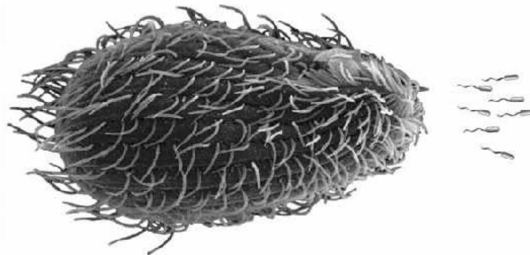
slika 4 Tetrahymena (lijevo) i bakterijski plijen (desno)

( http://www.sciencedaily.com/releases/2007/12/071203103405.htm )