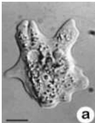
Slika 3. Acanthamoeba castellani

Acanthamoeba je dobila ulogu uzorka za proučavanje interakcije eukariotskih s prokariotskim stanicama. Ova vrsta interakcije jedna je vrsta simbioze. Inače proučavanje interakcija mikro-organizama ne traje duže od tri dana, ali proučavanje interakcija Acanthamoeba s bakterijama može trajati nekoliko tjedana. To nam pokazuje koliko mogu biti komplicirane veze među tim vrstama. Vrlo je bitno to da su Acanthamoeba predatori, i aktivno uzimaju bakterije za hranu. Upravo sposobnosti kao što su stvaranje cista, predatorska uloga te suživot s raznim bakterijama, uz otpornost na životne uvjete ali i na antibiotike i sl., čine ih vrlo dobrim primjerom za proučavanje interakcija eukariota i prokariota, te mogu imati alat za kultiviranje određenih bakterija (Abd, 2006).