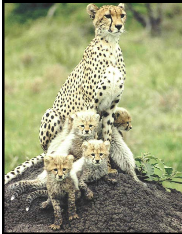
Slika 6. Afrički gepard ( Acinonyx jubatus jubatus )

U zagrebačkom zoološkom vrtu nalazi se 1 gepard, dok se u ostalim svjetskim zoološkim vrtovima i raznim drugim sličnim ustanovama, koji se nalaze u Međunarodnom informacijskom sustavu o životinjama u zatočeništvu – ISIS (International Species Information System) nalazi ukupno 1117 mužjaka, 812 ženki i 63 mladunaca (rođenih u proteklih 12 mjeseci). Preuzeto i prilagođeno iz http://www.isis.org/CMSHOME/ .