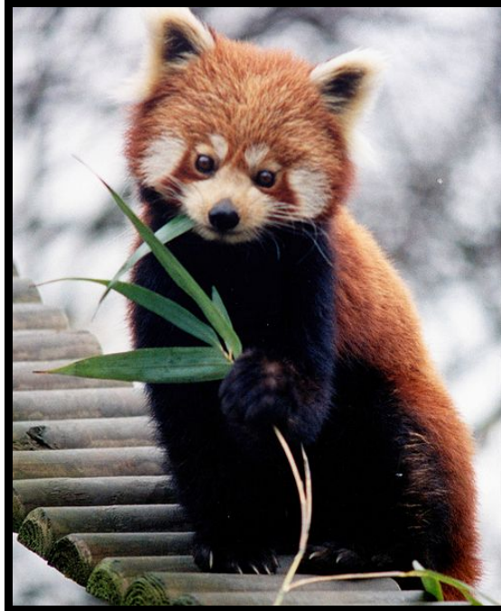
Slika 6. Crveni panda ( Ailurus fulgens )

U Zg ZOO nalazi se 1 mužjak i 1 ženka, dok u zatočeništvu u svijetu nalazimo 219 mužjaka, 231 ženku, te 26 mladunaca (rođenih u proteklih 12 mjeseci). Preuzeto i prilagođeno iz http://www.isis.org/CMSHOME/ .