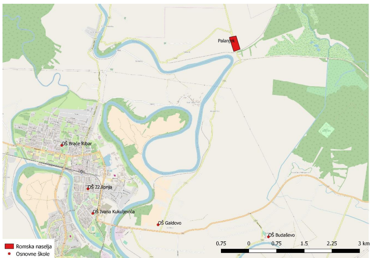
Sl. 7. Geografski položaj osnovne škole Galdovo i romskog naselja Palanjek

Osnovna škola Galdovo uz matičnu školu u svom sustavu ima i područnu školu Hrastelnica te dva područna odjela Tišina Erdetska i Setuš. Matična škola Galdovo sagrađena je 1963. godine (Kurikulum Osnovne škole Galdovo za školsku godinu 2016./2017.). Prvi Romi doselili su se na područje romskog naselja Palanjek 1970-ih godina i pohađali područnu školu u Hrastelnici. Tijekom 1980-ih i početkom 1990-ih tek je nekoliko Roma pohađalo osnovnu školu, a čak i ako su završili niže razrede, nisu nastavljali školovanje u višim razredima u matičnoj školi u Galdovu (sl. 7).