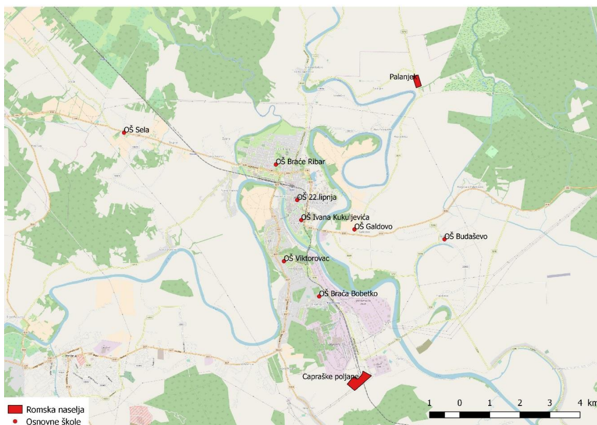
Sl. 6. Geografski položaj romskih naselja u gradu Sisku

Prema popisu stanovništva iz 2011. godine na području grada Siska živi 648 pripadnika romske nacionalne manjine. Procjenjuje se da je stvaran broj značajno veći. Prema dostupnim podacima Projekta građanskih prava Sisak iz 2013. godine, u Sisačko-moslavačkoj županiji živi 3561 pripadnik romske nacionalne manjine, a u Sisku 2165 pripadnika romske nacionalne manjine. Na području grada Siska Romi su nastanjeni u dva romska naselja: Capraške poljane i Palanjek. Capraške poljane su najveće romsko naselje na području Sisačko-moslavačke županije te se nalaze u blizini osnovne škole „Braća Bobetko“ koju većinom pohađaju. Romi u Capraškim poljanama žive u bespravno izgrađenim kućama koje su u lošem stanju. Naselje je opskrbljeno vodom i električnom energijom. Naselje Palanjek je ima manji broj stanovnika te puno bolje uvjete života od Capraških poljana, a nalazi se u blizini Osnovne škole Galdovo koju većina djece iz naselja pohađa (sl. 6).