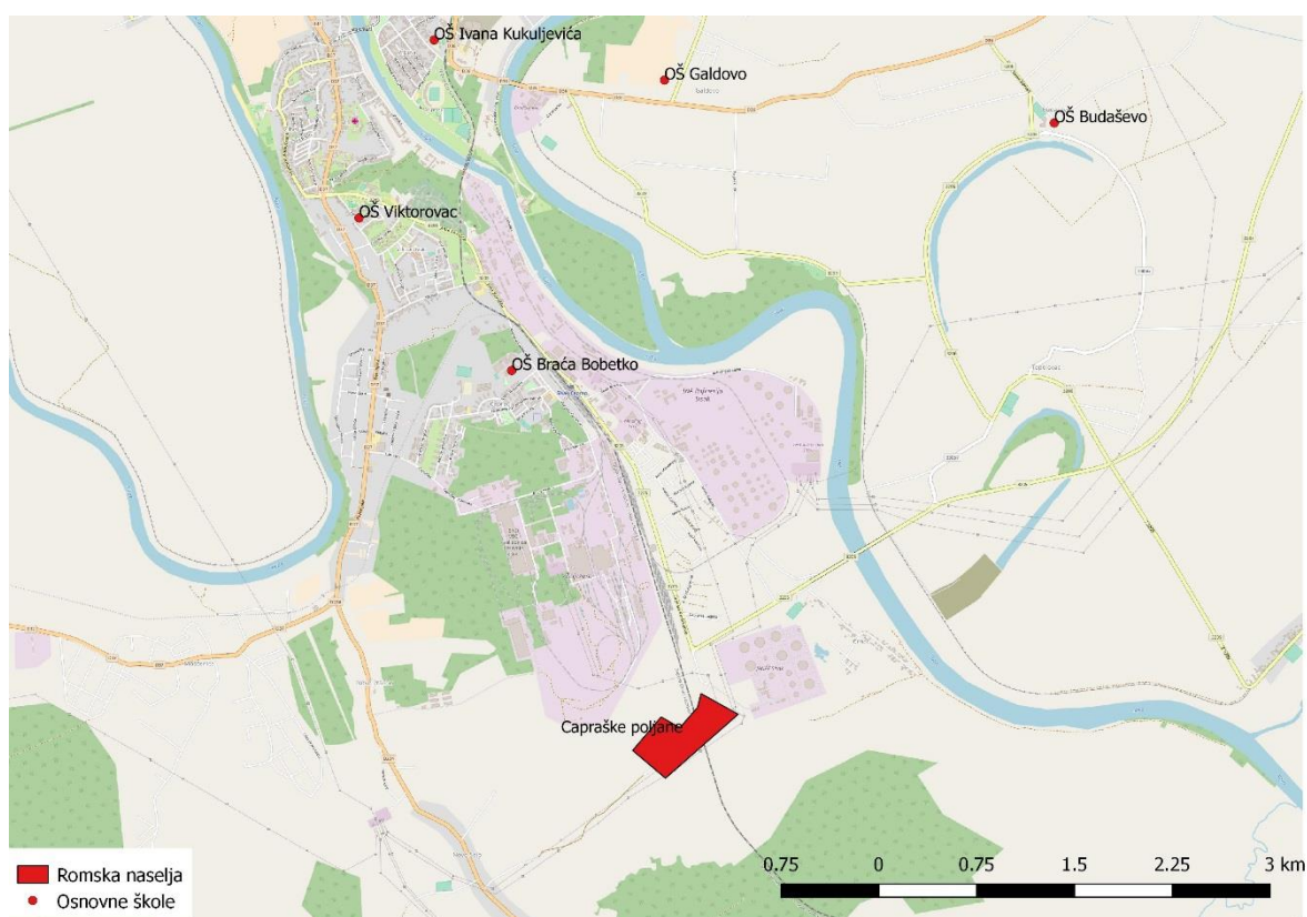
Sl. 8. Geografski položaj osnovne škole Braće Bobetko i romskog naselja Capraške poljane

Osnovna škola „Braća Bobetko“ uz matičnu školu ima i područnu školu u prigradskom naselju Crnac. Iako je područna škola Crnac bliža romskom naselju Capraške poljane sva djeca iz romskog naselja od prvog razreda osnovne škole pohađaju matičnu školu „Braća Bobetko“ (sl. 8). Prvi Romi doselili su se na područje romskog naselja Capraške poljane 1950-ih godina i vrlo rijetko su pohađali osnovnu školu. Romi su se doselili na ovo područje zbog velikih industrijskih pogona u Sisku te su se prvenstveno bavili skupljanjem i prodajom sekundarnih sirovina koje su pronalazili u tvornicama. Prema procjenama romske udruge „Prava Roma“ u naselju danas živi oko 1500 stanovnika.