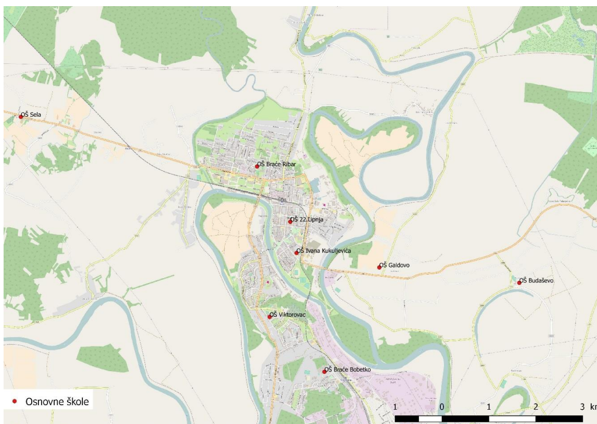
Sl. 1. Geografski položaj studija slučaja istraživanja

Kako je i u samom naslovu rada naznačeno, prostor istraživanja su osnovne škole kojima je osnivač Grad Sisak s naglaskom na škole s dominantnijim udjelom nacionalnih manjina u ukupnom broj učenika (sl. 1).