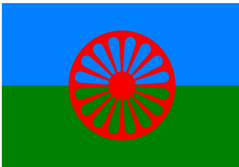
Sl. 2. Romska zastava

Roma predstavljeno je i u njihovoj zastavi koja sadrži kotač, nebo i travnate livade. Zastava ima dvije boje, plavu u gornjem dijelu, a zelenu u donjem dok se u sredini nalazi kotač. Zelena boja predstavlja nepregledne ravnice kojima lutaju, a iznad njih otvoreno nebo. Zastavu predstavlja vječno lutanje ravnicama pod otvorenim nebom (sl. 2).