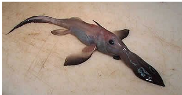
Slika 10. Harriotta raleighana ( www.oddee.com )

Pripada porodici Rhinochimaeridae. Obitava na dubinama između 200 i 2600m, doseže veličinu do 1,5m. Na leđnoj peraji ima vrlo otrovnu bodlju koja joj služi za obranu od predatora. ( www.oddee.com )