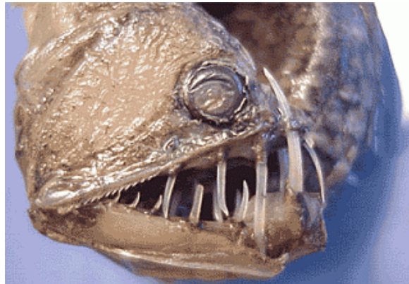
Slika 4. Chauliodus sloani

Pripada porodici Stomiidae, tijelo mu je izduženo i obavijeno želatinoznim ovojem. Često je potpuno bez pigmenta i sadrži brojne fotofore duž leđne peraje. Zubi su veliki i dugi te probijaju gornju čeljust koja je izrazito fleksibilna i može se široko rastvoriti (sl.4.).(Debelius H., 2001.)