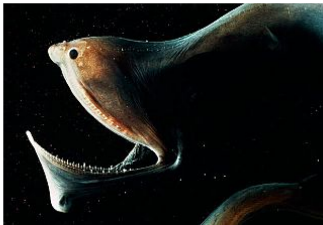
Slika 9. Eurypharynx pelecanooides