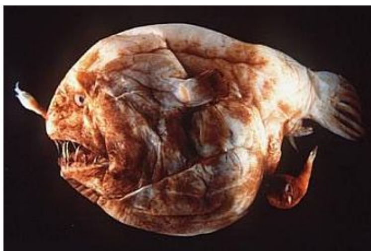
Slika 2. Vrsta Melanocetus johnsonii ( www.oddee.com )

Volumen koji obuhvaća duboko more je izuzetno velik. Mora dublja od 1000m čine 90% površine oceana. Ovako velik prostor stvara poteškoće kako u pronalaženju partnera tako i hrane. Jedna od bitnih prilagodbi riba koje žive u ovakvim uvjetima je i razvoj spolnog dimorfizma. Najbizarniji primjer javlja se u porodice Melanocetidae, red Lophiiformes.(sl.2.) Mužjak je u ovom slučaju izrazito malen, doseže 20 do 40 mm duljine, dok ženka naraste i do 1,2m kod nekih vrsta. Mužjak uglavnom potpuno parazitira na ženki tako da se pričvrsti za nju, njegovi unutarnji organi degeneriraju, s iznimkom sjemenika koji često zauzimaju više od polovice njegova celoma.( www.allthesea.com )