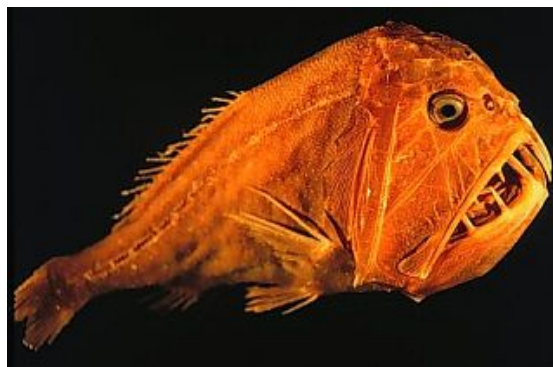
Slika 5. Anoplogaster cornuta

Zmijozub nastanjuje najdublje dijelove batipelagijala, ima duge zakrivljene zube, velike čeljusti i kratko tijelo. Zbog uvjeta u kojima obitava uglavnom je strvinar. Mlade jedinke se izrazito razlikuju od odraslih. (Hutchins M., Thoney D.A., Loiselle P.V, Schlager N., 2003)