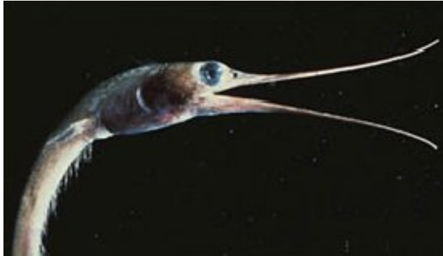
Slika 11. Nemichthys scolopaceus

Na temelju svojih izduženih čeljusti ova je vrsta dobila i naziv „dubokomorska patka“. Doseže duljinu od 1,5m. Hrani se manjim rakovima na dubini od 700 do 1000m. U tijelu ima više kralješaka nego ijedna druga životinja, njih čak 750. (Hutchins M., Thoney D.A., Loiselle P.V, Schlager N., 2003.)