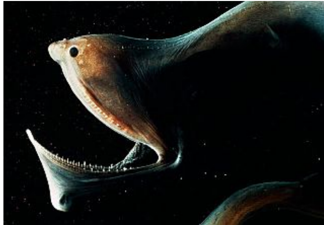
Slika 9. Eurypharynx pelecanooides