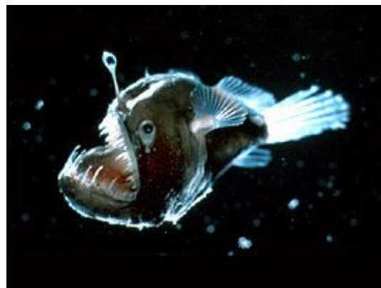
Slika 8. Melanocetus johnsoni

Bentopelagička vrsta, često nazivan i „crnim vragom“ zbog svog neobičnog izgleda. Izraslina na gornjoj čeljusti služi mu pri hvatanju plijena te su različite vrste unutar ove porodice dobile ime upravo prema načinu lova. Kod porodice Melanocetidae vrlo je izražen spolni dimorfizam.(Debelius H.,2001.)