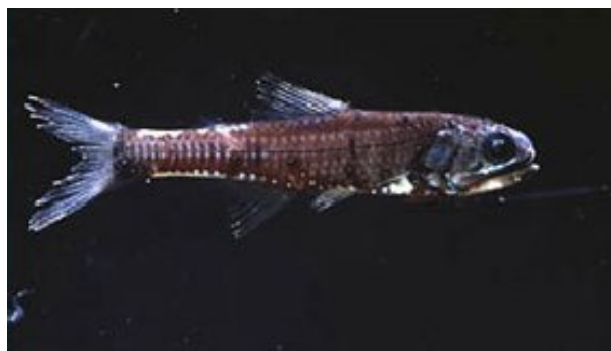
Slika 12. Stenobranchius leucopsarus

Pripadnik porodice Myctophidae. Svaka vrsta unutar ove porodice ima različit uzorak svjetlećih organa (fotofora) na svojoj bočnoj i ventralnoj strani tijela. Pri traženju partnera uvijek će tražiti ribu istog uzorka. Mezopelagička je vrsta i obitava na dubinama do 1000m. (Debelius H.,2001.)