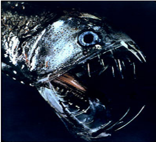
Slika 1. Iglozub ( Chauliodus sloani )

Za razliku od njih, batipelagičke vrste su manje, imaju velike pomične čeljusti s oštrim zubima (sl.1.), često potpuno reducirane oči, velik želudac, fotofore, te ekstremnu redukciju kostura i mišića. Njihova lokomocija je ograničena zbog usporenog metabolizma i uštede energije. Prisutan je također i bizaran oblik spolnog dimorfizma. (Helfman G. S., Collette B.B., Facey D.E., Bowen B.W., 2009.)