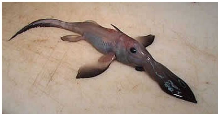
Slika 10. Harriotta raleighana ( www.oddee.com )

Pripada porodici Rhinochimaeridae. Obitava na dubinama između 200 i 2600m, doseže veličinu do 1,5m. Na leđnoj peraji ima vrlo otrovnu bodlju koja joj služi za obranu od predatora. ( www.oddee.com )