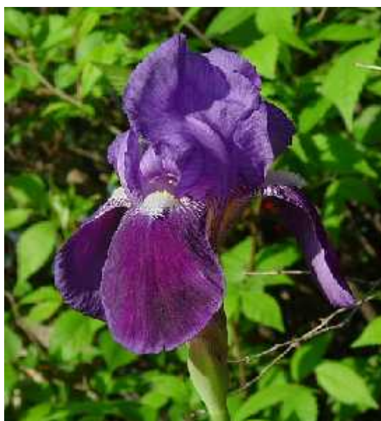
Slika 5. Iris germanica L, cvijet

Iris germanica L. (sl. 5) roditeljska je vrsta brojnim kultivarima bradatih perunika koje možemo pronaći u gotovo svakom vrtu. Smatra se da potječe iz Sredozemnog dijela Južne Europe, a udomaćio se u vrtovima i pobjegao u prirodna staništa diljem Sjeverne hemisfere. U prirodi postoji nekoliko varijeteta s raznim bojama cvjetova, a u hortikulturi kombinacije boja su bezbrojne. (Köhlein 1981., Schulze 1988., http://www.missouriplants.com/Bluealt/Iris_germanica_page.html )