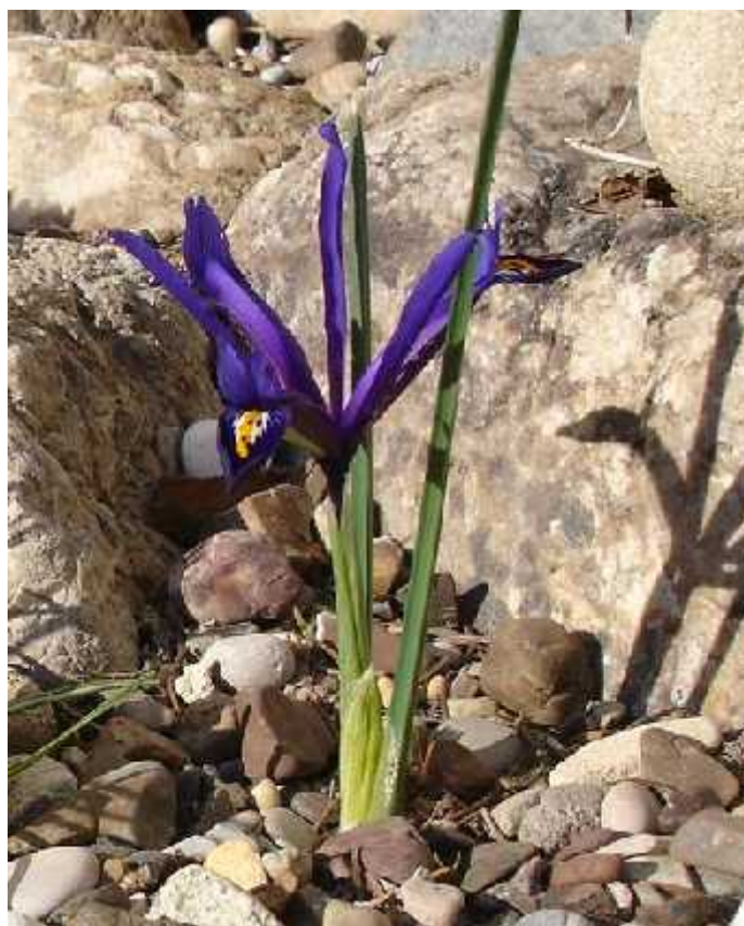
Slika 12. Iris reticulata Bieb.

Iris reticulata Bieb. (sl. 12) najbolje je poznata vrsta iz ovoga malog podroda. Krajem zime cvjeta cvjetovima koji mogu biti obojeni plavo ili ljubi asto. Postoje mnogi prirodni, ali i umjetni varijeteti. Biljke sa cvijetom su visoke od 7 do 14 cm, a staništa su im od Turske, Irana, Iraka, bivšeg SSSR-a, gorje Kavkaz i Transkavkaška regija. (Köhlein 1981., http://www.pacificbulbsociety.org/pbswiki/index.php/ReticulataIrises )