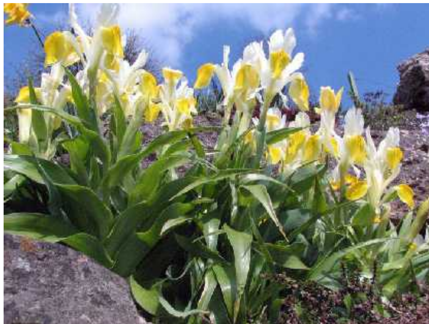
Slika 11. Iris bucharica Foster

Iris bucharica Foster (sl. 11) naj eš e je kultivirani pripadnik podroda. Cvjeta bijelo-žutim cvjetovima, a listovi su široki i kao kod ve ine Juno irisa raspore eni tako da podsjeaju na mali kompaktni kukuruz. Potje e iz sjeveroisto nog Afganistana, Tadžikistana i Uzbekistana gdje raste na kamenitim i travnatim obroncima na velikim visinama. ((Köhlein 1981., http://www.pacificbulbsociety.org/pbswiki/index.php/JunoIris )