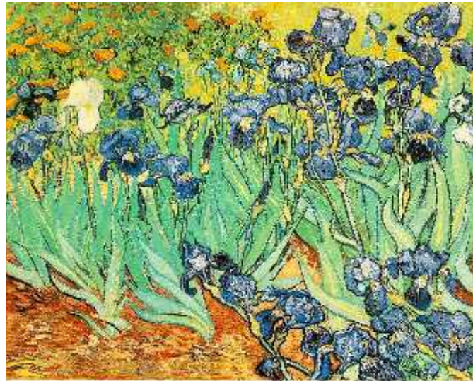
Slika 2. Vincent van Gogh: Iri (1889) ( http://www.irisinns.ca/images/vangogh3.jpg )

svoje pala e dao oslikati perunikama. Egipatska, ali i indijska kultura koristile su ove cvjetove za prikaz života i ponovnog ro enja. Razne kulture su se kroz povijest koristile ovim cvijetom kao simbolom neke vrste uzvišenosti kao što su pobjeda, vjera, nada, mudrost ili hrabrost, stoga ne udi da ga tako esto pronalzimo u heraldici. Inspiracija su nebrojenim umjetnicima nekada i danas, a možda najpoznatije ovjekovje ene perunike na platnu su one Vincenta van Gogha (sl. 2)