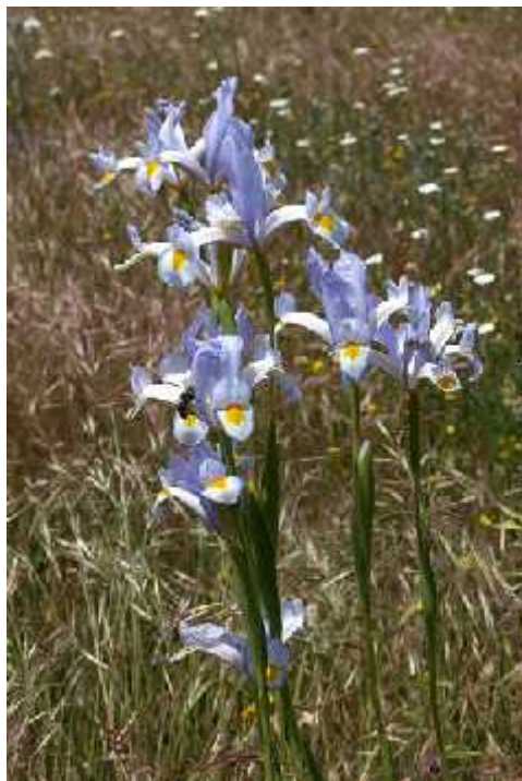
Slika 9. Iris xiphium L.

(Köhlein 1981., http://www.pacificbulbsociety.org/pbswiki/index.php/SpanishIris , http://en.wikipedia.org/wiki/Iris_xiphium )