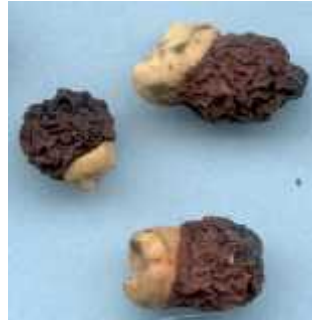
Slika 6. Sjemenke irisa koje nose arilus ( http://www.badbear.com/newasi/index.pl?Arils )

Sekcije Psammiris , Oncocyclus , Pseudoregalia i Regalia imaju arilus na sjemenci, pa se ponekad za njih koristi naziv arilni irisi. Arilus (sl. 6) je bijela mesnata struktura na sjemenci koja privlači mrave koji zatim sjemenku odvlače u svoje nastambe, te na taj način pomažu u raznošenju i klijanju sjemena. Predstavnici ove tri sekcije su najcijenjeniji irisi u hortikulturi jer su često tamno obojeni, prošarani tamnim točkama ili pak nose crnu bradu.