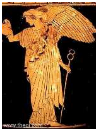
Slika 1. Božica Irida

Naziv Iris dolazi od grčke božice duge te glasnice bogova Iride (sl. 1). Starogrčke legende pišu da je božica Irida ljudima prenosila poruke bogova pomoću duge. Vjerovalo se da bi tamo gdje bi duga dotaknula zemlju, izrastao cvijet iris. Legende se zasnivaju na činjenici da irise možemo naći u raznim bojama, a svaka vrsta ima velike cvjetove koji privlače oko i pozornost.