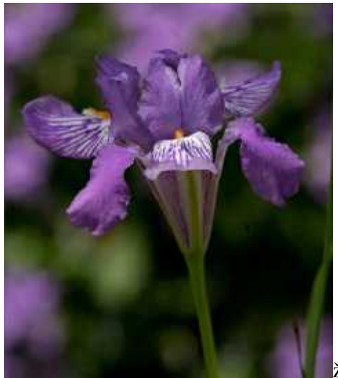
Slika 10. Iris collettii Hooker, cvijet

Iris collettii Hooker (sl. 10) minijaturan je iris koji potječe sa Himalaja, Kine, Burme i Tajlanda. Raste na sunanim suhim travnjacima na visinama od 1650 do 3500 metara nadmorske visine. Ima jako kratak rizom, te jako zadebljalo korijenje (gomolje). Listovi su dugi desetak centimetara u vrijeme cvatnje, a poslije se izdužuju do oko trideset centimetara. Cvjetovi su ljubičaste boje i nose bradu. (Köhlein 1981., http://www.bulbsociety.org/GALLERY_OF_THE_WORLDS_BULBS/GRAPHICS/Iris/Iris_collettii/Iris_collettii.html )