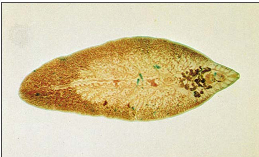
Slika 1. Fasciola hepatica

Uzročnik ove bolesti je kozmopolitsko rasprostranjena vrsta veliki ili ovčji metilj – Fasciola hepatica (Linnaeus, 1758) (Slika 1) (Srebočan i Gomerčić, 1989).