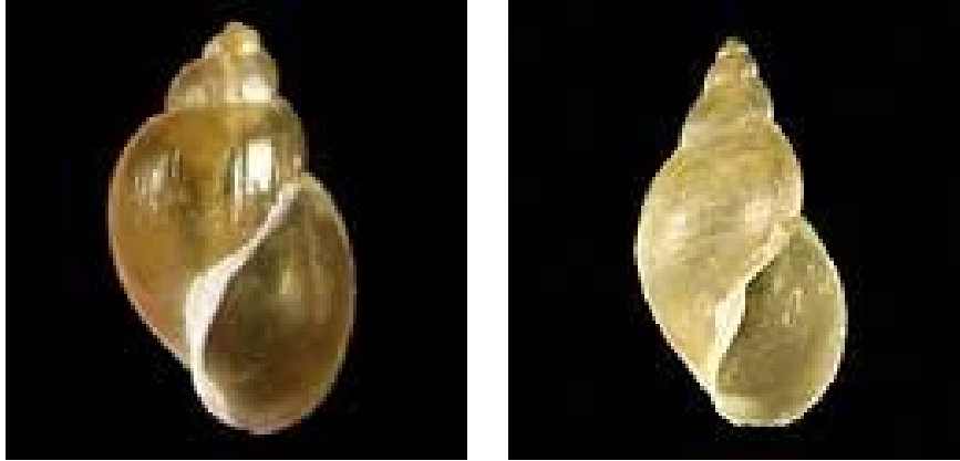
Slika 3. Mali barnjak - Galba truncatula