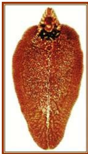
Slika 2. Fasciola gigantica

Na području Afrike, Bliskog istoka, istočne Europe, južne i istočne Azije bolest uzrokuje vrsta Fasciola gigantica (Linnaeus, 1758) (Slika 2). Oboljenje kod ljudi je rezultat slučajnosti ( www.dpd.cdc.gov ).