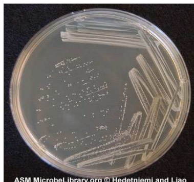
Slika 3. Kolonije Staphylococcus epidermidis