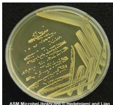
Slika 1. Kolonije Staphylococcus aureus