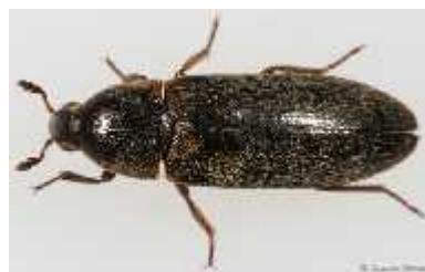
Slika 12. D. maculatus (imago)