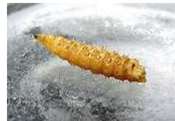
Slika 5. C. rufifacies (li inka)

Li inka je prepoznatljiva radi svog specifičnog izgleda. Dobila je ime „dlakavi crv“ jer svaki tjelesni koluti ima srednji red mesnatih „tuberkula“ koje im daju dlakav izgled iako ne posjeduju prave dlake. Puparium je tvrdokorna i smežurana vanjska koža zrele li inke.