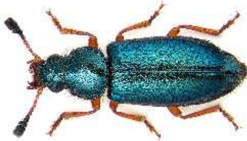
Slika 8. Necrobia rufipes (imago)

Kornjaš vrste Necrobia rufipes je svjetlucavo metalik plavo-zelena boje. Noge su smeđe crvenkaste ili narančaste. Elitre su prekrivene čekinjama poput vlasi. Trbušna strana je tamno plava. Odrasli se lako rasprše i formiraju nove kolonije. Ličinke su krema sive boje išarane tamno ljubičasto-sivim mrljama na leđima. Kao izvor hrane voli sušeno meso, dimljeno meso i sušene ribe. Jako su im primamljivi proizvodi koji su pohranjeni neomotani duže vrijeme pa su na taj način privučeni i ljudskim ili životinjskim leševima. Odrasli se hrane na površini leša, a ličinke prodiru u strvinu uzrokujući i daljnje štete. Ženke polažu jaja u pukotine u mesu. Jaja su glatka, prozirana, oko 1 mm duga, sljepljena u grozdovima na površini izvora hrane. Ličinke kopaju rupu u tijelu, gdje se hrane te se razvijaju kroz tri ili četiri stadija, a zatim