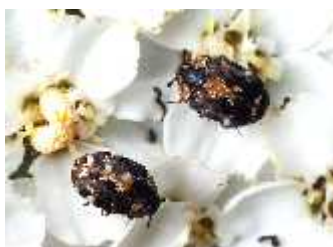
Slika 10. Dermestidae

Kornjaši porodice Dermestidae (kožojedi) imaju tamne pokrovnice krila, a tijelo je sa strane blago bijelkasto. Sve su ličinke duže od odraslih kornjaša, vitke, gusto pokriveno kratkim i dugim crveno-smeđim do crnim dlakama s dvije bodlje okrenute naprijed na vrhu blizu kraja zatka.