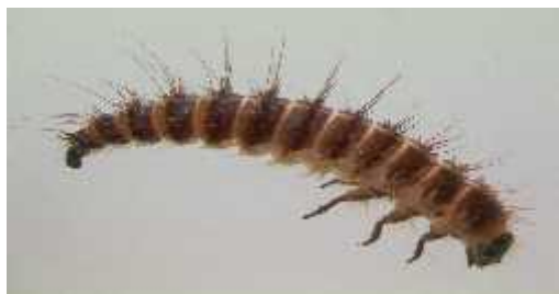
Slika 11. D. maculatus (liinka)

U forenzici veliku važnost u određivanju vremena smrti ima vrsta Dermestes maculatus . Slično kao i kod muha, dolazak D. maculatus na strvinu je također predvidljiv događaj. Odrasli kornjaši općenito dolaze 5 do 11 dana nakon smrti na leš. U pokušaju da se to nije procjeni njihov dolazak (jer je raspon od 6 dana preširok), ponovo su provedene studije koje su uključivale nekoliko vrsta porodice Dermestidae . Naravno, kao i kod ostalih kukaca, razvoj Dermestidae je ovisan o temperaturi, a optimalna temperatura za D. maculatus je 30°C. Ovi kornjaši su, također, od velike važnosti za entomotoksikologiju, gdje se fecesi i ličinski svlak mogu testirati na različite toksine, što uvelike pridonosi slučaju, kada je tijelo već u podmakloj fazi raspadanja ( www.wikipedia.org ).