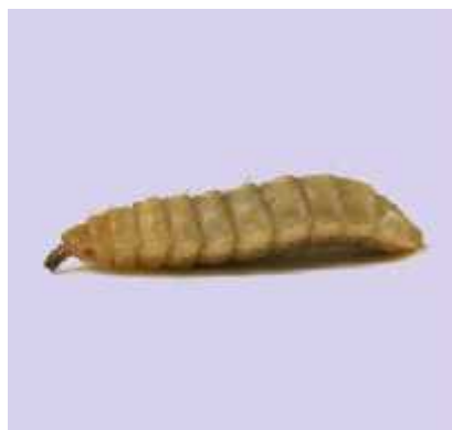
Slika 8. Hermetia illucens (ličinka)