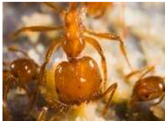
Slika 6. Solenopsis geminata