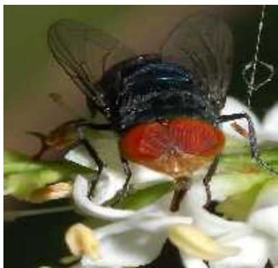
Slika 2. Chrysomya megacephala (imago)