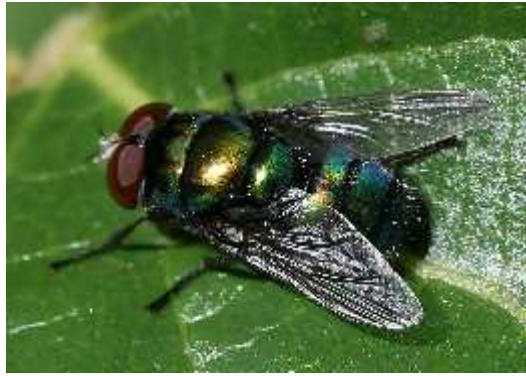
Slika 4. C. rufifacies (imago)

Carstvo: Animalia - životinje Koljeno: Arthropoda - lankonošci Razred: Insecta - kukci Red: Diptera - dvokrilci Podred: Brachycera - kratkoticalci Odjeljak: Muscomorpha - muhe Pododjeljak: Calyptratae Nadporodica: Oestroidea Porodica: Calliphoridae - zujare Podporodica: Chrysomyinae Rod: Chrysomya Vrsta: C. rufifacies