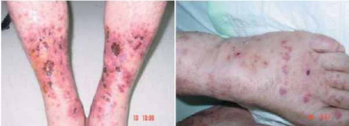
Slika 7. Ugrizi S. geminata

Radnici imaju snažan žalac, koji nije ni malo bezopasan, pa čak ni za uvijek. Ako ste zabunom stali na gnijezdo, radnici će se polako penjati uz noge, a zatim će svi odjednom pošet gristi.