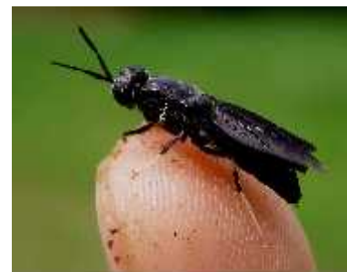
Slika 9. H. illucens (imago)