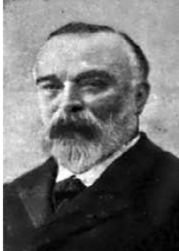
Slika 1. Paul Camille Hippolyte Brouardel

Paul Camille Hippolyte Brouardel, rođen u Saint-Quentinu 13. veljače 1837., postao je član Francuske medicinske akademije 1880. Radio je na tuberkulozi, cijepljenju i sudskoj medicini. Njegovi brojni medicinsko-pravni zapisi uključuju praktične savjete za kolege koji rade u mrtvačnicama.