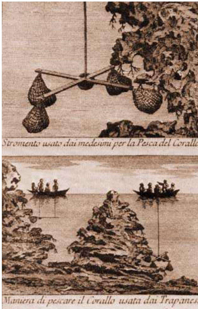
Slika 5.: Inženj ( http://www.archeogate.it/subacquea/article.php?id=122 )