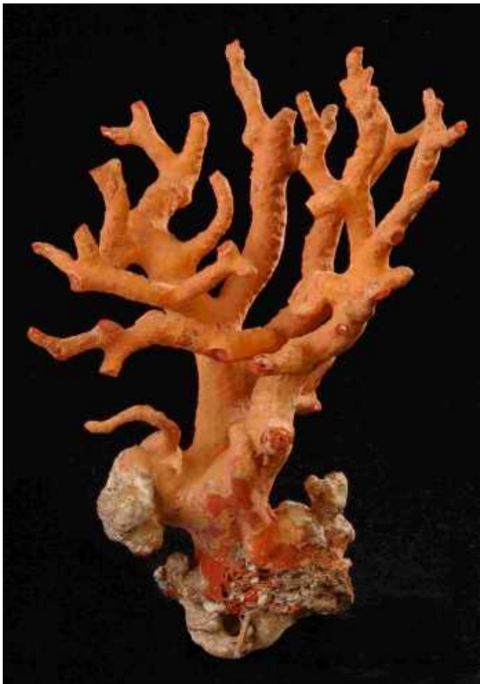
Slika 6.: Neobra eni crveni koralj

Na podru ju Levanta su ga od davnina koristili kao lijek za bolesti o iju. Za krš ansku religiju, crvena boja koralja bila je simbol Isusove krvi i njegove žrtve, zbog ega su njime esto bili ukrašavani relikvijari Svetog križa. Prikazivan je na mnogim renesansnim religioznim slikama poput Masacciove Gospe s djetetom (1426.) i Gospe s Djetetom, svecima i vojvodom koji kle i , 1472. i Gospe iz Senigallija , oko 1474 (Slika 7.) od Piero della Francesca. U srednjem vijeku je bio obi aj nositi komadi e koralja u nov aniku kao amajlija protiv uroka. Prah crvenog koralja stavljao se djeci u hranu, kako bi ih zaštitio od epidemija. Na Zlarinu su se neprera eni koralji koristili kao crkveni ukrasi i zavjetni darovi. Nakit od crvenog koralja vrlo je popularan i danas (Slike 8 i 9).