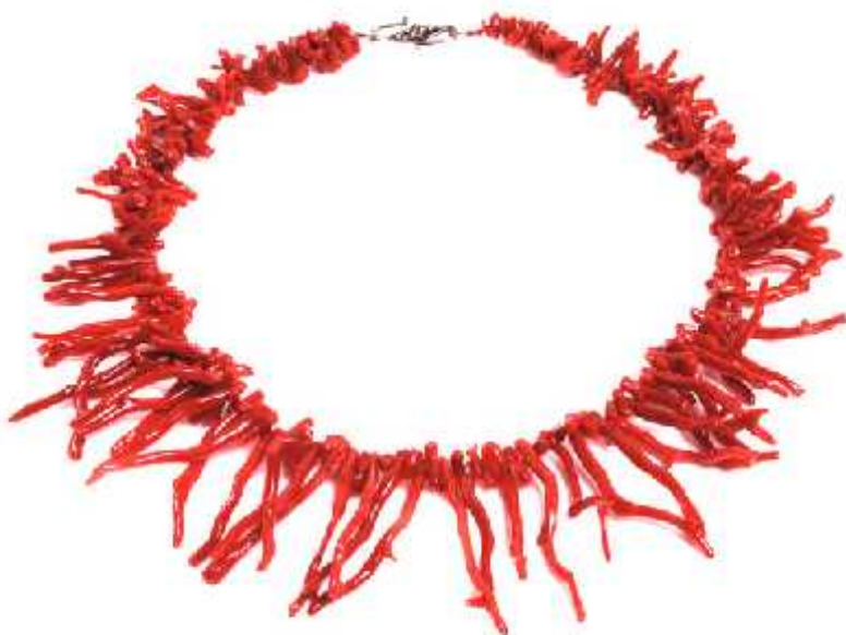
Slika 9.: Ogrlica od crvenog koralja ( http://www.mydesignerjewellery.co.uk/blog/246/pebble-red-coral-necklace/ )