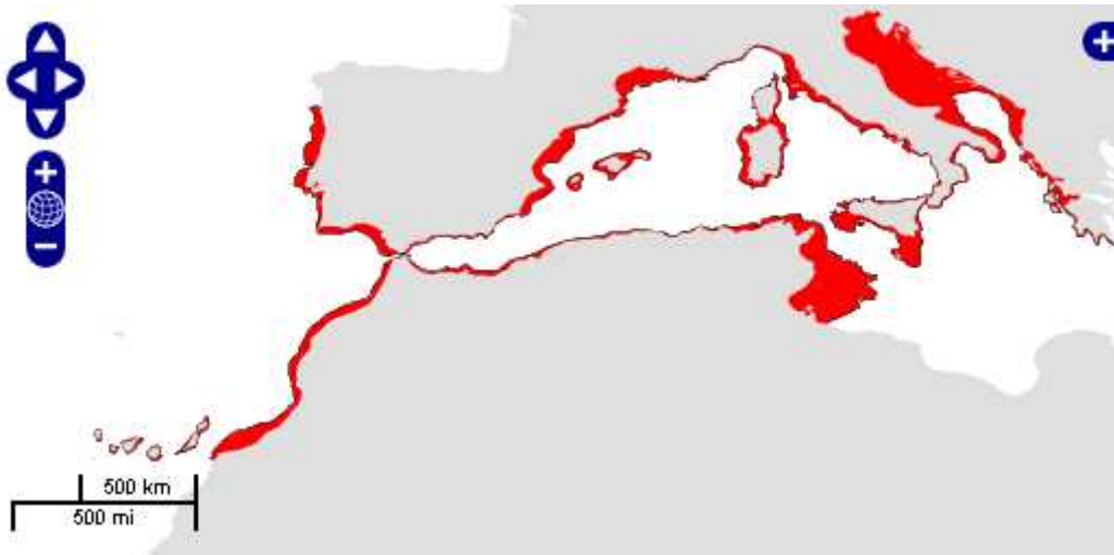
Slika 4.: Rasprostranjenost crvenog koralja ( http://www.fao.org/fishery/species/3611/en )

U svjetskim morima postoji 27 vrsta iz porodice Gorgoniaceae , od kojih samo 5 živi u Atlantskom oceanu. Crveni koralj je jedina vrsta roda Corallium koja živi u Mediteranu (druge vrste roda Corallium nalazimo u Japanskom moru (ruži asti ili crveni koralj C. japonicum ) i Atlantiku (bijeli koralj C. johnsoni )), ali ga nalazimo i u isto nom dijelu Atlantskog oceana. Od atlantskih vrsta razlikuje se po svojoj jarko crvenoj boji. Nalazimo ga u Jadranskom i Egejskom moru, uz obale Sardinije, Korzike, Sicilije, južne obale Francuske, te sjeverne obala Afrike od Tunisa do Gibraltara, ali i na atlantskim obalama Portugala, Kanarskih otoka, oto ja Cape Verde, i isto ne Afrike (Maroko). est je na isto noj obali Jadrana (od otoka Premuda pa do zaljeva Trašte u Crnogorskom primorju) jer mu odgovara tamošnje hridinasto podmorje s mnogo litica, prevjesa i podmorskih spilja.