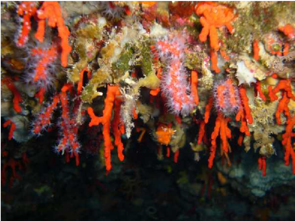
Slika 3.: Kolonije crvenog koralja u spilji

Živi na dubinama između 20 i 200 m, iako se može naći i na manjim dubinama na zasjenjenim mjestima poput svodova spilja. Danas se zbog intenzivnog izlova u Jadranu rijetko nalazi na dubinama manjim od 60 m.