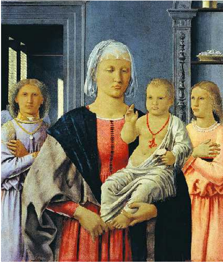
Slika 7.: Piero della Francesca Gospa iz Senigallija , oko 1474. ( http://it.wikipedia.org/wiki/File:Madonna_di_Senigallia.jpg )