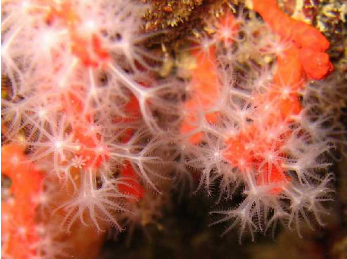
Slika 2.: Polipi crvenog koralja