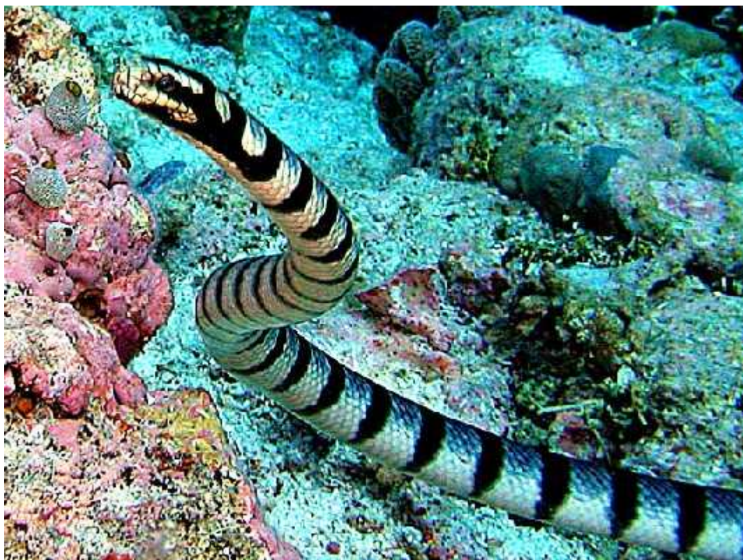
Slika 3. – Laticauda colubrina

Za razliku od većih lovaca, mnoštvo endoparazita je prihvatilo morske zmije kao plijen. Neki su specifični jer obično parazitiraju na kopnenim kralješnjacima, ali se nalaze i u morskim zmijama roda Laticauda koje se redovito kreću u kopnom. Primjer je grinja vrste Vatacarus ipoides koja parazitira u dušniku na vrsti Laticauda colubrina (slika3.). "Većine grinje koje izgledaju poput larvi (crva) ili neosomi, bile su ograničene na gornji dio dušnika, nekoliko ih je našlo u stražnjem dijelu, ali niti jedna u plućnom krilu." (Nadchatram, M. 2006.) Kod raznih zmija pronađeni su i različiti nematodi u probavilu ili plućnom krilu, grinje u plućnom krilu i sl. Ektoparaziti su rijetki, nekoliko vrsta grinja i krpelja koji su također parazitiraju na rodu Laticauda .