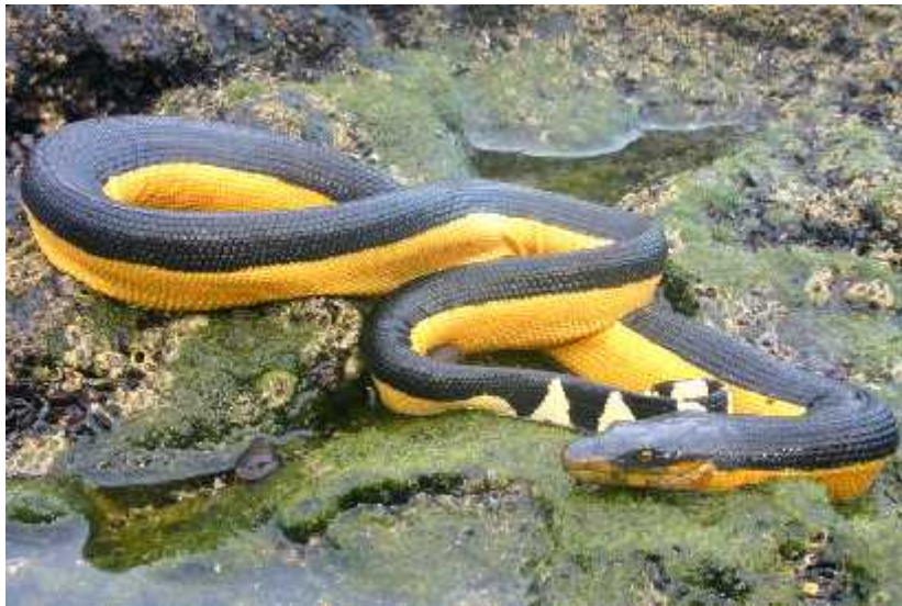
Slika 2. – Pelamis platurus

Neke zmiје su toliko ozloglašene da gotovo nemaju neprijatelja. Pelamis platurus (slika 2.) je u vodama koje naseljava siguran od napada predatorskih riba, čak i morskih pasa. "Ira Rubinoff i Chaim Kropach su u akvarijima s morskom vodom proveli eksperimente koji su pokazali da plejada predatorskih riba, uključujući i morske pse, ne samo da nisu nadali jedinku Pelamis platurus , već su obično i odbijali njihovo meso, čak i kada je bilo bez kože, isječeno na komade, različito obojano ili stavljeno između komada mesa sipa." (Heatwole, Harold, (1987.)1999.) Ptice koje ulove jedinku ove vrste ubrzo je odbace. Ako tko zabunom pojede meso ove vrste brzo ga povrati. Samo su rakovi suzama zamjenili da jedu njihove strvine. Očito je da i boja i kemijski spoj koji ova vrsta izlučuje imaju utjecaja. Predatori koji nisu autohtoni morima koje vrsta naseljava često su pokazali da nemaju nikakvih problema sa lovom ove zmiје, ali su meso svejedno povratili. Ostale morske zmiје imaju svoje predatore među pticama npr. Haliastur indus i H.leucogaster , morskim psima, rakovima npr. Scylla serrata .