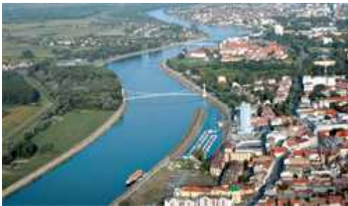
Sl. 7. Gradnja hidroelektrana kao pomoć ljudima, a na štetu životinjama ugrožavanjem staništa

Na sreću, u Podravini se počinje buditi svijest o potrebi oporavka i brizi o ranjivim i nadasve ugroženim vodozemcima. Važno je upoznati djecu, mlade, ali i odrasle sa raznim vrstama žaba, vodenjaka i daždevnjaka koje žive u Podravini. Posebna se važnost pridodaje najvećim dijelom ugroženim i strogo zaštićenim vrstama. Putem publikacija (letci, knjige, plakati, majice, multimedija) i organiziranja akcija, radionica i izložbi nastoji se proširiti znanje o prirodi i oporaviti ove ugrožene vrste od nestajanja i stradavanja zbog toga što su zaboravljeni, a u nekim slučajevima i zbog predrasuda- prezreni dio prirode.