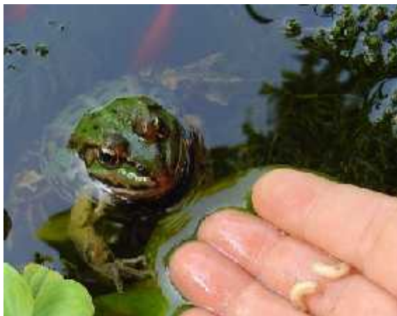
Sl. 1. Vodozemci su važni predatori malih beskralješnjaka

Vodozemcima su primarna hrana kukci i ostali beskralješnjaci, uključujući i one koji su prenosnici ljudskih bolesti (npr. komarci - prijenosnici malarije). Postoje procjene da je samo jedna populacija od 1000 žaba sposobna pojesti čak 5 milijuna beskralješnjaka u periodu od jedne godine. Očito je da su vodozemci jako važni predatori malih beskralješnjaka (Sl. 1.), ali isto su tako i izdašni izvor hrane za veće kralješnjake. Oni su važna poveznica tih dvaju nivoa u hranidbenom lancu. Njihovim nestajanjem dolazi do domino efekta i urušavanja ekosustava što može imati drastične posljedice i za uvijek (Bishop, 2006.).