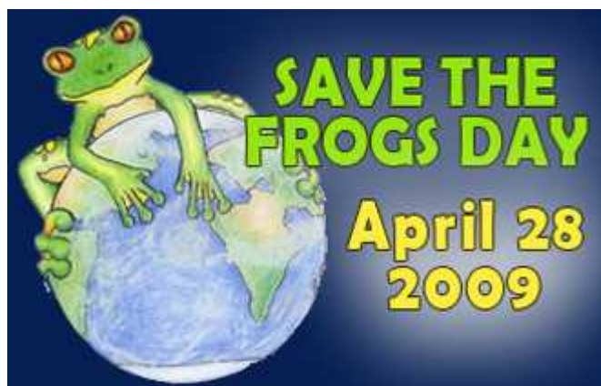
Sl. 2. Izrada plakata povodom obilježavanja prvog Svjetskog dana zaštite žaba

Upozoravaju se svi ljudi i moli ih se da se uključe i rašire ovu vijest! Važno je upamtiti da je jako mali postotak šire javnosti svjesan da vodozemci nestaju, te da naponi za zaštitu vodozemaca neće biti uspješni sve dok činjenica da je broj vodozemaca (vrsta, kao i populacija) u drastičnom opadanju ne postane općenito poznata. Krajnji je cilj je da "kriza izumiranja vodozemaca" postane općenito poznata stvar do 2013. godine.