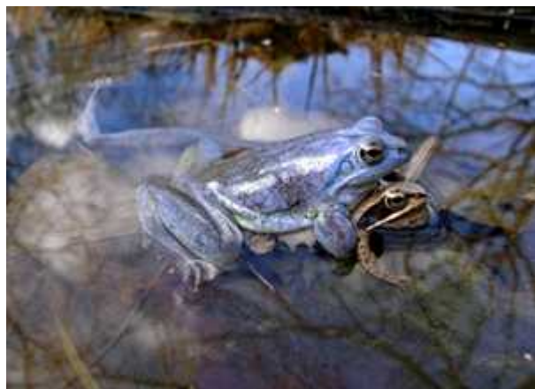
Sl. 4. Parenje ženke i plavo obojenog mužjaka mo varne smeđe žaba ( Rana arvalis )

Zanimljivo je da postoji mogućnost da katkad naiđemo i na žabe vrlo neobičnog i neuobičajenih boja. Tako postoji i plava boja kod nekih žaba, i to pripadnika muškog spola. Plava obojenost sasvim je normalna pojava u životu jednog mladog mužjaka mo varne smeđe žabe (lat. Rana arvalis ). Takav mužjak svojom bojom zapravo želi svim prisutnim ženkama jasno i glasno reći da je spreman za parenje. (Sl. 4.) Cijela priroda ustvari započinje krajem zime, u ožujku ili travnju. Tada dnevne temperature dosegnu 15-17°C te se mužjaci i ženke žaba počinju okupljati radi parenja. Radi privlačenja ženki mužjaci postupno mijenjaju boju, iz normalne smeđe-crvenkaste s tamnim pjegama, u tamno-ljubičastu, a na kraju konačno i u prepoznatljivu nebeskoplavu. Što je savršenija plava boja mužjaka to će više ženki privući i time si osigurati više potomstva. Mužjaci se uz boju, ujedno služe i glasanjem karakterističnim samo za ovu vrstu, čime se partneri prepoznaju.