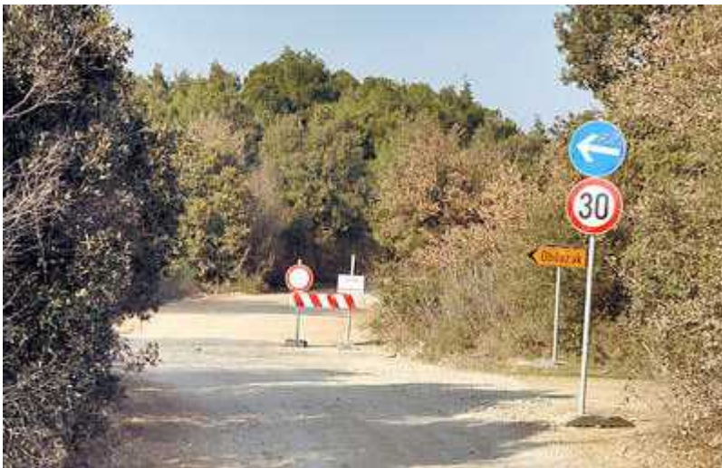
Sl. 9. Gradnja prometnica jedan je od načina ugrožavanja staništa vodozemaca

Promjena staništa je takav utjecaj na stanište koji utječe na funkciju ekosistema, čak i ako to nije potpuno ili trajno. Primjer je ispaša stoke. Stoka može izgaziti vodenu vegetaciju i izazvati ubrzanu eroziju obale bare čime stanište postaje nepovoljno za vodozemce. Rješenje za ovaj problem bilo bi ograničavanje dijela bare kako bi se stoci onemogućio pristup, što za posljedicu ima nesmetan rast vegetacije na ograničenom dijelu.