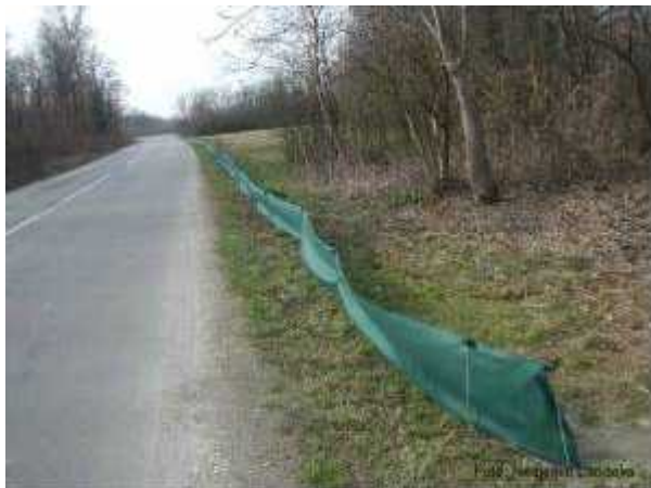
Sl. 13. Postavljene mreže uz rub ceste s velikim intenzitetom prelaska žaba

Mreže se postavljaju uz rub ceste na lokacijama s velikom intenzitetom prelaska žaba. (Sl. 13.) Cilj im je usmjeriti žabe koje migriraju prema tunelu ili prema mjestu na kojem se skupljaju i prenose. Efikasnije su od prometnih znakova pri održavanju populacije. Razlikuju se trajne mreže koje zahtijevaju održavanje od obraštaja vegetacijom jednom godišnje. Postoje i privremene koje je potrebno postavljati jednom godišnje početkom sezone i nakon završetka migracije ukloniti. Ovaj tip mreža zahtijeva organizirani angažman lokalnog stanovništva.