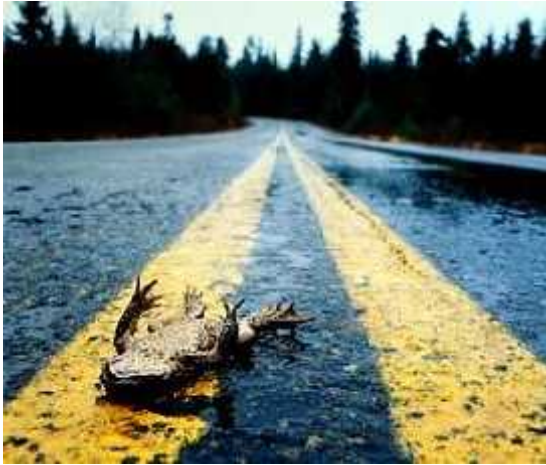
Sl. 5. Stradavanje vodozemaca na prometnicama; pregažena žaba