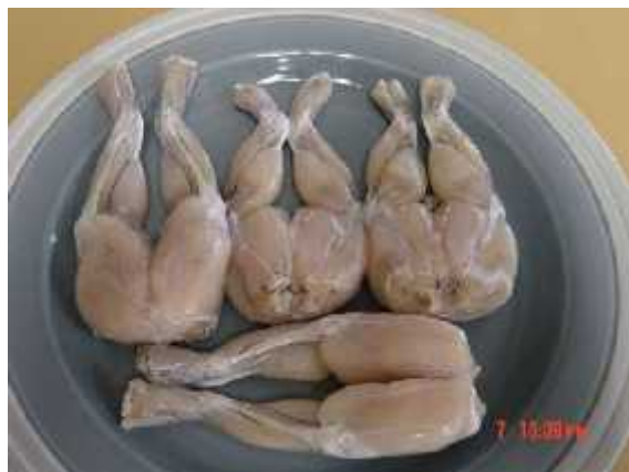
Sl. 10. Žabljaci kao izvor hrane i delicija u restoranima diljem svijeta

Diljem svijeta vodozemci se sakupljaju i uzgajaju za iskorištavanje. Vodozemci se upotrebljavaju u prehrani, kao ljubimci, u medicini, obrazovanju i istraživanjima te kao mamci za ribe. Glavni izvor hrane među vodozemcima su žabljaci. (Sl. 10.)