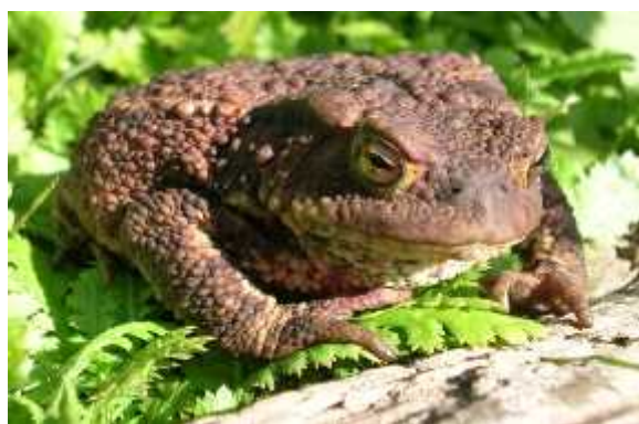
Sl. 14. Jedan od najugroženijih pripadnika vodozemaca Podravine: siva gubavica ( Bufo bufo L.)

Iako ljudi misle da je ovo rijedak i izoliran slučaj, istina je sasvim drugačija. Procjenjuje se da bez zapreka na prometnicama strada više od 80% žaba na putu do mrjestilišta! Zbog takvih bi poražavajućih podataka trebalo provoditi više akcija postavljanja zapreka na svim mjestima gdje prometnice sjeku dugogodišnje migracijske putove vodozemaca. Prometnice su time po ele narušavati prirodnu ravnotežu ekosustava, u kojem upravo vodozemci imaju jednu od ključnih uloga. Pošto su vodozemci prvi na udaru, akteri Podravskog projekta „SOS-poziv za pomoć vodozemcima“ pokušavaju smanjiti nestajanje raznih vrsta vodozemaca. Aktivnostima ovog projekta spas vodozemcima pokušavaju pružiti jake volonterske snage. Najugroženiji vodozemci Podravine pripadnici su vrsta: siva gubavica ( Bufo bufo L. ) (Sl. 14.) te zelena gubavica ( Bufo viridis L. ). (Sl. 15.)