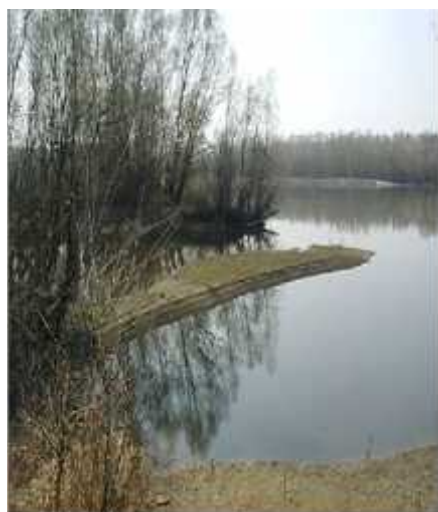
Sl.6. Drava kao riječni tok i stanište mnogim biljnim i životinjskim vrstama

Drava je u Hrvatskoj ujedno i jedan od posljednjih prirodnih, slobodnih rijeka u tokovima u Europi. Dom je i mnogih vrsta ptica te prostor također bogat biljnim vrstama. Mnoge vrste biljaka, riba, kukaca, sisavaca i vodozemaca protežu se uzduž riječnog koridora Mure i Drave.