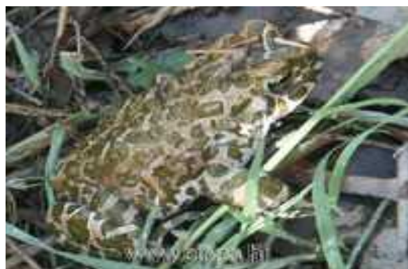
Sl. 15. Veoma ugrožen vodozemac Podravine: zelena gubavica ( Bufo viridis L. )