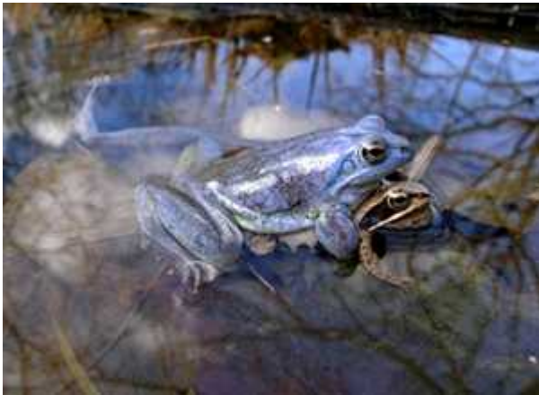
Sl. 4. Parenje ženke i plavo obojenog mužjaka mo varne smeđe žaba ( Rana arvalis )

Zanimljivo je da postoji mogućnost da katkad naiđemo i na žabe vrlo neobičnog i neuobičajenih boja. Tako postoji i plava boja kod nekih žaba, i to pripadnika muškog spola. Plava obojenost sasvim je normalna pojava u životu jednog mladog mužjaka mo varne smeđe žabe (lat. Rana arvalis ). Takav mužjak svojom bojom zapravo želi svim prisutnim ženkama jasno i glasno reći da je spreman za parenje. (Sl. 4.) Cijela priroda ustvari započinje krajem zime, u ožujku ili travnju. Tada dnevne temperature dosegnu 15-17°C te se mužjaci i ženke žaba počinju okupljati radi parenja. Radi privlačenja ženki mužjaci postupno mijenjaju boju, iz normalne smeđe-crvenkaste s tamnim pjegama, u tamno-ljubičastu, a na kraju konačno i u prepoznatljivu nebeskoplavu. Što je savršenija plava boja mužjaka to će više ženki privući i time si osigurati više potomstva. Mužjaci se uz boju, ujedno služe i glasanjem karakterističnim samo za ovu vrstu, čime se partneri prepoznaju.