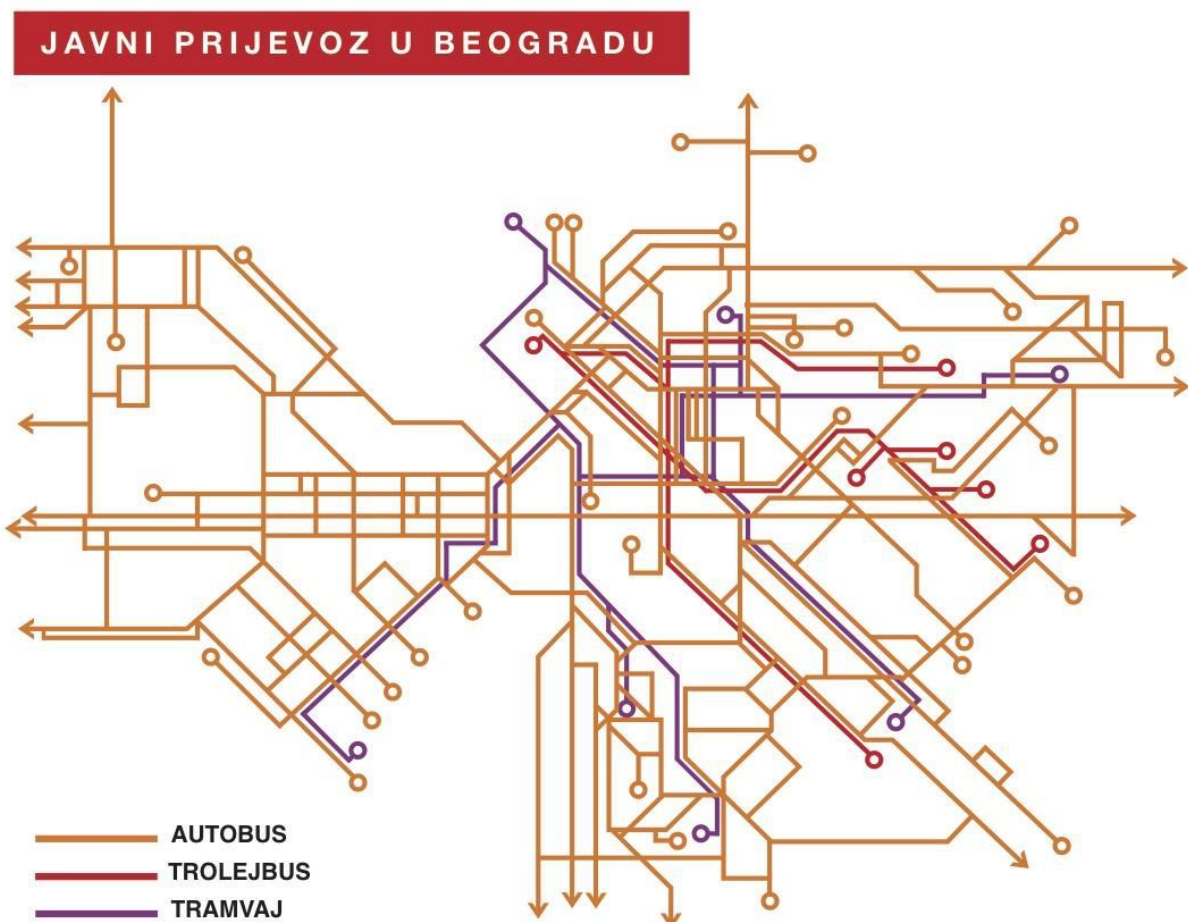
Sl. 1. Shema oblika mreže u Beogradu