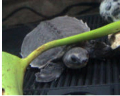
Sl. 9. Australoazijska pig-nose kornjača