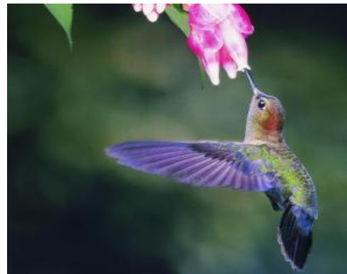
Sl. 11. Kolibrić u letu

Kao i za mnoge druge žive fosile i za kolibriće( Sl. 11 ) se isprva smatralo da su se razvili relativno nedavno jer su najstariji pronađeni fosili stari 1 do 2 milijuna godina bili iz Novog svijeta, sve dok 2004. godine iskapanje u Njemačkoj ( Perkins, 2004) nije donijelo dva nova fosila za koje se ispostavilo da potječu iz Starog svijeta i stari su između 30 i 34 milijuna godina. Ta je činjenica ovim malim pticama zaradila titulu živih fosila..Iako ih ima preko 300 živućih vrsta, nalazimo ih samo na području američkog kontinenta.