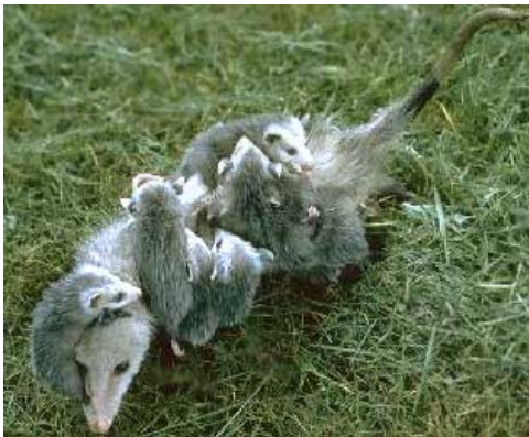
Sl.16.Ženka sjevernoameričke naboruše sa mladuncima

Svejed je, dobro se penje, pliva i snalazi na tlu. Kada je u opasnosti, pretvara se da je mrtav-nepomično leži otvorenih usta iz kojih viri jezik i otvorenih očiju i iz izmetnog otvora ispušta smrdljivu tekućinu.