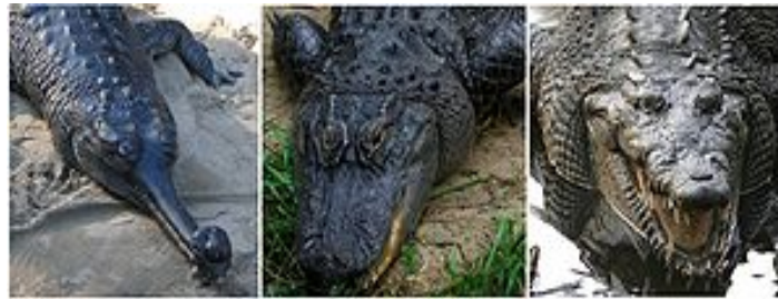
Sl. 8. S lijeva na desno: indijski gavijal ( Gavialis gangeticus ), američki aligator ( Alligator mississippiensis ), američki krokodil ( Crocodylus acutus )

Danas živi krokodili dijele se u tri grupe sa statusom porodica. Pri tom se porodica gavijala sastoji od samo jedne recentne vrste, indijskog gavijala. Crocodylidae, ili pravi krokodili, prepoznatljivi su po udubini u gornjoj čeljusti u koju ulazi četvrti zub donje čeljusti tako da je izvana vidljiv. Kod aligatora (Alligatoridae) se kod zatvorenih čeljusti ne vide zubi, a i njuška im je šira i nešto kraća nego kod krokodila.