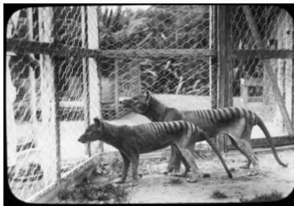
Sl. 19. Posljednji živi primjerci u zatočeništvu prije nego su izumrli 1936.g.