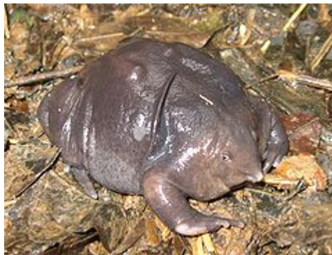
Sl. 6. Ljubičasta žaba za vrijeme monsuna

Kad se uzmu u obzir njena izrazito izbočena njuška i malena ventralno smještena usta, vrlo je vjerojatno da se radi o vrsti specijaliziranoj za termite kojima se hrani isključivo pod zemljom (Dutta et al. 2004; Radhakrishnan et al. 2007).