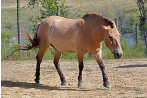
Sl. 17. Mongolski divlji konj

kromosoma(najvjerojatnije povećanja) došlo relativno nedavno( Ishida i sur. 1995 ). Ima 66 kromosoma dok domaći ima 64. Mogu se međusobno pariti i producirati fertile potomke sa 65 kromosoma.