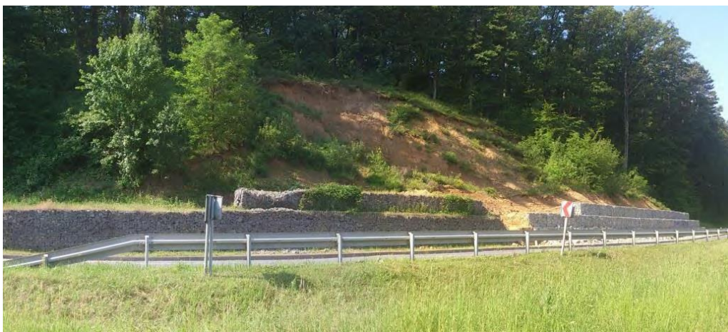
Slika 3. Sanirano klizište na državnoj cesti D2 Našice-Orahovica

Investitor sanacije klizišta bile su Hrvatske ceste, a radove je izvodila tvrtka Cesting d.o.o. Sanacija je izvedena potpornim gabionskim zidovima 1 , a planirana je u više faza: prva faza je pokazala da je područje sanacije potrebno povećati te se pristupilo drugoj fazi sanacije. Istaknuta je važna uloga smanjenja troškova u razradi mjera sanacije, odnosno mogućnost fazne izvedbe s obzirom na raspoloživa sredstva za sanaciju.