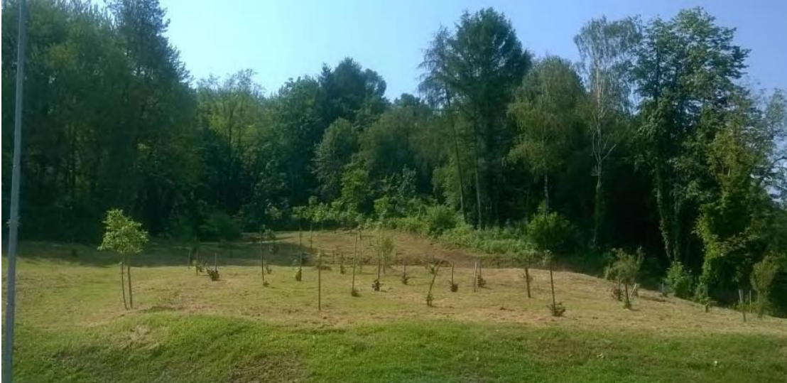
Slika 5. Sanirano klizište u Orahovici