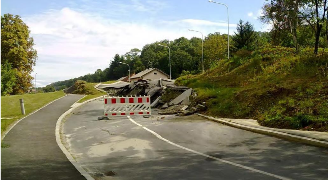
Slika 4. Klizište u Orahovici prije sanacije

Još jedno sanirano klizište nalazi se u Orahovici. Ovo klizište sanirano je na drugačiji način.