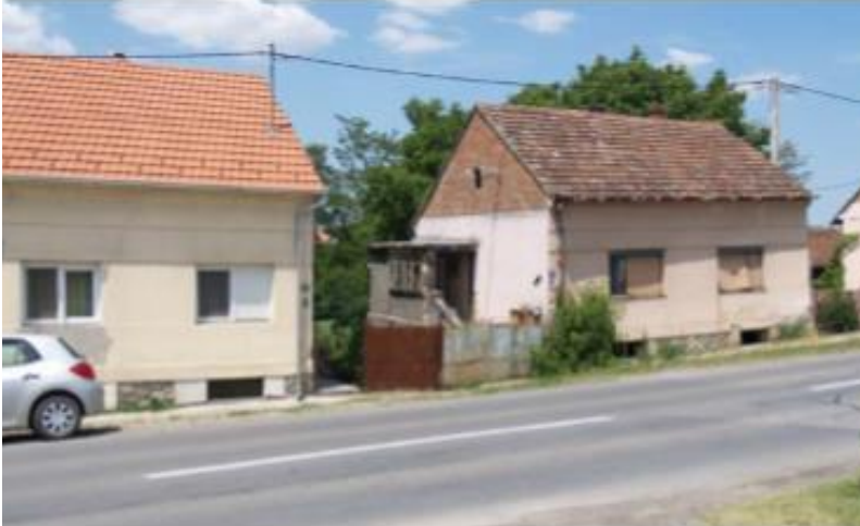
Slika 2. Klizište u Ulici Kralja Tomislava brojevi 74 i 76

Kuća na broju 74 (desno) je u propadanju, nenastanjena te se nitko ne brine za nju. Do vlasnika upisanog u zemljišne knjige nije se uspjelo doći. Na kući je vidljivo deformiranje i raspadanje. Vlasnik objekta na broju 76 ističe da povremeno sanira veća oštećenja i pukotine no oni su i dalje vidljivi u podrumu kuće. Zbog svega toga od nadležnih gradskih službi zatražena je sanacija klizišta. Sukladno tome provedena su terenska istraživanja; geodetski radovi, inženjersko geološki radovi i bušenje s izvođenjem standardnih pokusa da se utvrdi dubina klizanja. Na temelju provedenih geotehničkih istražnih radova zaključeno je da je lokacija bila zahvaćena klizanjem u bližoj geološkoj prošlosti prije urbanizacije šireg područja. Te istraženo klizište predstavlja samo rub tog starog klizišta, koje je duži period mirovalo, no urbanizacijom tog područja uvjeti lokacije su se počeli znatno mijenjati sve do trenutka kad su faktori sigurnosti pali na dovoljno male vrijednosti. Iz tog razloga provedene su analize stabilnosti koje su objavljene u Geotehničkom elaboratu o uzrocima klizanja s prijedlogom optimalnih sanacijskih mjera te je dokazano da na tom području dolazi do aktivacije novih klizanja za koje su mjerodavni parametri posmične čvrstoće tla blizu rezidualnim (Ortonal et al, 2013).