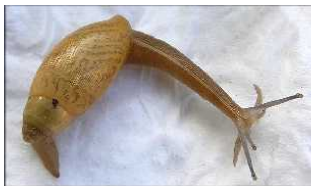
Slika 6. Juvenilna jedinka vrste E. rosea