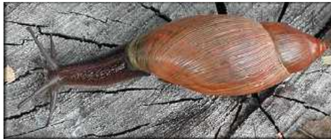
Slika 1. Euglandina rosea (Férussac)