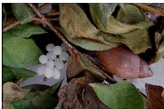
Slika 5. E. rosea polaže jaja