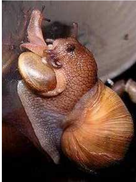
Slika 3. E. rosea se hrani vrstom Bradybaena similaris

puževi roda Deroceras uspijevaju izbjeći i napad brzim mahanjem "repa", sprečavaju i tako da ih E. rosea dohvati radulom. Za vrstu E. rosea poznati su i slučajevi kanibalizma. Naime, ve se kao mladi hrane drugim jedinkama iz legla te jajima ( www.weichtiere.at ). Njihove hranidbene prilagodbe su djelom određene potrebama za kalcijevim karbonatom. Zbog svega navedenog njihovo drugo englesko ime glasi "cannibal snail".