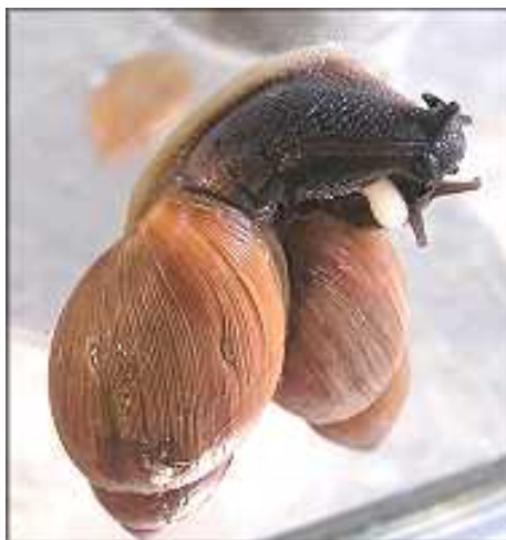
Slika 4. Parenje dviju jedinki puža E. rosea