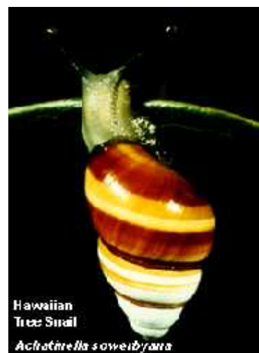
Slika 8. Achantinella sowerbyana