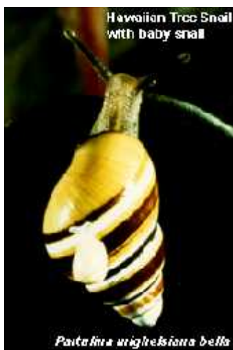
Slika 7. Partulina mighelsiana bella

Nakon po etnog unosa 1950-tih, puž se brzo proširio po oto ju Havaja. Ve je 1958. godine 12 tisu a jedinki bilo spremno za daljnje unošenje na druge otoke i krajeve (Japan, Filipini i dr.) ( www.edis.ifas.ufl.edu/IN523 ). Na otoku Oahu, 1958. godine, invazivna se vrsta proširila na sve morske visine uzrokuju i ve tada lokalno nestajanje mnogih populacija Achatinella . Danas se E. rosea nalazi na mnogim staništima izvan areala vrste A. fulica , zbog koje je unesen, i njezin se prodor mogao pratiti s postupnim nestajanjem roda Achantinella (Barke, 2004).