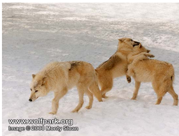
Slika 11. Igra www.vukovi.hr

Vukovi izvođe lažne borbe, love se i skaču jedni na druge (sl.11). Najdraža igra im je „napadanje“ iz zasjede neopreznih članova čopora. Igru može započeti bilo koji vuk s bilo kojim drugim članom čopora, neovisno o hijerarhiji ( www.wolfcountry.net ).