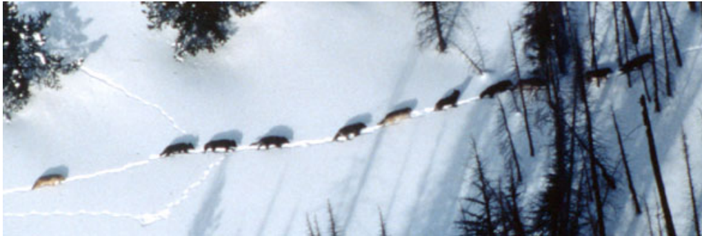
Slika 6. Čopor

kojoj žive vukovi zove se čopor (sl. 6). Vukovi mogu živjeti i sami, ali to su obično starije jedinke istjerane iz čopora ili mladi vuk u potrazi za vlastitim teritorijem.