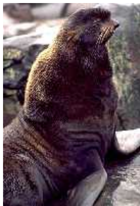
Slika 4. Sjeverni morski lav, Callorhinus ursinus , iz porodice Otariidae

Prelaskom na kopno, dolazi do brze i nagle promjene unilateralnog u bilateralno spavanje karakteristi no za terestri ke sisavce. Pojavljuju se i NREM i REM faza spavanja. ak ne postoji nikakav oblik rekuperacije vremena spavanja s obzirom na izostanak REM faze u vodi. (Lyamin i sur. 2004.)