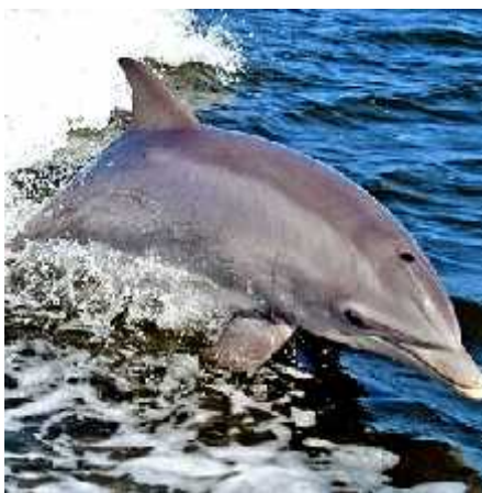
Slika 5. Dobri dupin, Tursiops truncatus , iz reda Cetacea

Smatram da će daljnja istraživanja ovog fenomena rasvijetliti evolucijske putove spavanja i mehanizme sna kako morskih tako i terestričkih sisavaca.